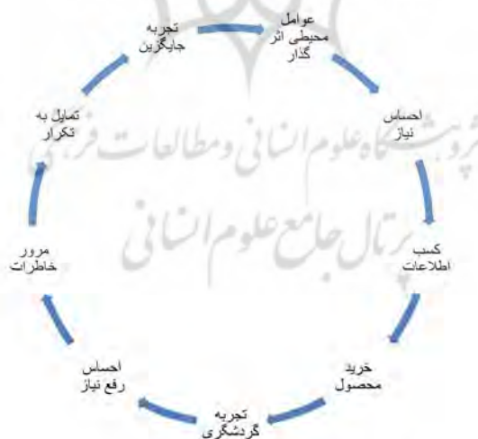
شکل دو: مراحل فرایند گردشگری

در نهایت عرضه کنندگان و مصرف کنندگان کالاهای فاخر گردشگری به حد نهایی ترفاخر ۳ در توریسم که همانا کمال مقصود در سرویس های مبتنی بر گردشگری است چشم دوخته اند و با هر گام سعی در نزدیک شدن به این چشم انداز دارند. مراد از حد کمال در گردشگری رسیدن به نقطه ای است که گردشگر به صورت مطلق و در تمام فرایند گردشگری (شکل دو) یعنی از لحظه احساس نیاز به شرکت در یک تجربه جدید توریستی، تا زمان مرور خاطرات احساس رضایت و برآورده شدن تمام نیازها و رسیدن به تمام آرزوها در کنار حس خوشایند شگفتی و برتری را داشته باشد. در دیگر سو ارائه دهندگان خدمات لوکس گردشگری با رویکرد جدید علمی سعی در شناسایی نیازهای موجود و نیز ساخت نیازهای آینده گردشگران فاخر در راستای فروش خدمات خود دارند تا با برآورده ساختن نیازهای ایجاد شده جدید، مراحل جدیدی از ترفاخر را در گردشگری آزمایش کنند. البته شایان توجه است که عامل سلیقه شخصی ۴ همیشه به عنوان بردار مخالف تمام جریان رو به کمال در گردشگری را تحت تاثیر قرار داده و از رسیدن به این مرحله جلوگیری می کند. این بدان معناست که در گردشگری لوکس به لحاظ ساختار و ماهیت آن سر و کار تولیدکنندگان پس از تامین نیازهای اساسی با سلیق مشتریان خصوصا خواسته های قائم به شخصیات و روحیات یا خواسته ها است. یک تولیدکننده محصول گردشگری لوکس هرگز نخواهد توانست برای تمام سلیق مشتریان خدمات ارایه دهد، چرا که در وادی سلیقه انسانها کاملا متفاوت و برخی غیر قابل پیش بینی هستند.