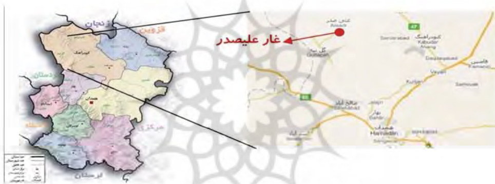
شکل ۱: موقعیت جغرافیایی غار علیصدر

امکان دسترسی به غار علیصدر از چهار مسیر فراهم است: مسیر یک: جاده همدان - بیجار، بعد از گل‌تپه در جاده فرعی سراب - علیصدر، طول مسیر ۷۵ کیلومتر از شهر همدان؛ مسیر دو: جاده همدان - کرمانشاه، صالح آباد، بخش گل‌تپه، ادامه تا غار علیصدر، طول مسیر ۸۰ کیلومتر از شهر همدان؛ مسیر سه: جاده همدان - رزن، تقاطع سهراهی پایگاه هوایی نوژه، ورود به جاده کبودرآهنگ، گل‌تپه تا غار علیصدر، طول مسیر ۱۱۰ کیلومتر از شهر همدان؛ مسیر چهار: از طریق جاده زنجان، قیدار تا غار علیصدر؛ در شکل ۱ موقعیت جغرافیایی غار علیصدر نمایش داده شده است.