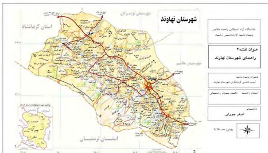
نقشه ۲: راهنمای شهرستان نهاوند