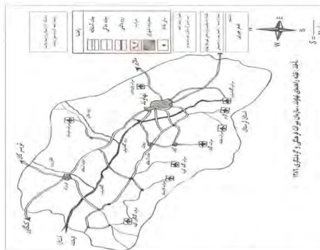
نقشه ۳: راهنمای سراب‌های شهرستان نهاوند