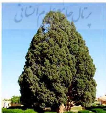
تصویر شماره ۱: سرو اول ابرکوه

سرو ابرکوه گرچه کهنسال‌ترین موجود زنده دنیاست و طول عمر آن حداقل ۴۵۰۰ سال است، قطر تنه بیش از ۳ متر و قطر تاج بیش از ۱۴ متر می‌باشد. ارتفاع این سرو ۲۵ متر است، تصویر شماره (۱) سرو اول را نشان می‌دهد.