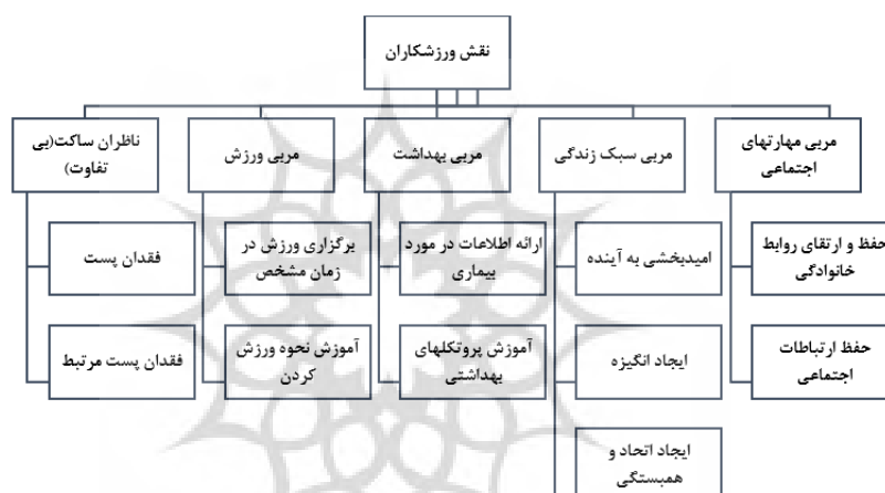
شکل ۱- نقشه تماتیک سلسله مراتبی نقش‌های تربیتی ورزشکاران در عالم گیری کرونا در اینستاگرام

به همین دلیل، ورزشکاران مشهور و نخبه در دوران عالم گیری، نقش‌های مختلفی را در شبکه اینستاگرام بر عهده داشتند. در ادامه هر نقش و زیرمجموعه‌های آن در قالب تحلیل ولکات به صورت تفسیر لایه‌ای الگوی تماتیک (شکل ۱) تحلیل می‌شوند و برای این امر از روش تحلیل تفسیری استفاده شده است.