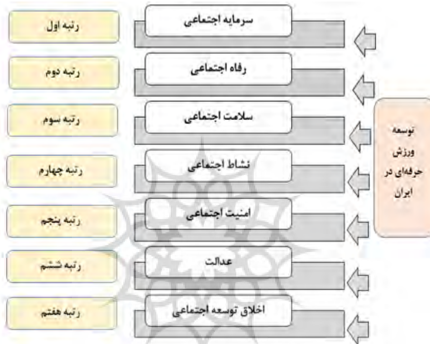
شکل ۳- رتبه‌بندی تأثیرپذیری شاخص‌های توسعه اجتماعی از ورزش حرفه‌ای

حرفه‌ای بر شاخص‌های اجتماعی، در شکل شماره سه، رتبه‌بندی شاخص‌های اجتماعی در کشور ایران به‌واسطه تأثیرپذیری از ورزش حرفه‌ای نمایش داده شده است. با توجه به میزان تأثیر ورزش حرفه‌ای بر شاخص‌های توسعه اجتماعی ایران این رتبه‌بندی انجام شد.