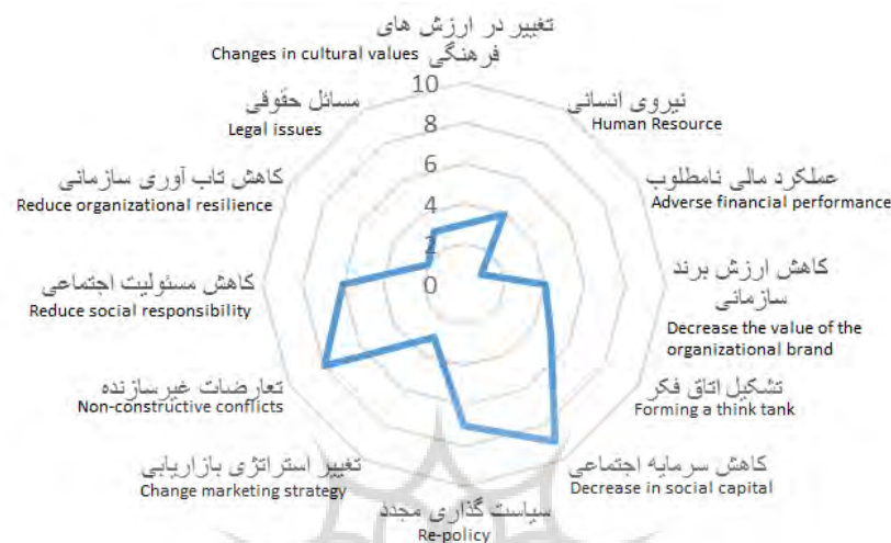
شکل ۲- اولویت‌بندی پیامدهای بحران کوید-۱۹ بر سازمان‌های حامی لیگ برتر فوتبال ایران Figure 2- Prioritizing the Consequences of the COVID-19 Crisis on the Organizations Supporting the Iranian Football Premier League