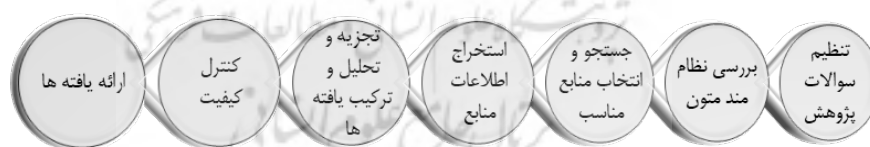
شکل ۱. فرایند هفت‌مرحله‌ای ساندوسکی و روسو (۲۰۰۶)

در این پژوهش از روش فراترکیب کیفی به منظور دستیابی به اهداف موردنظر استفاده شد. فراترکیب کیفی یک رویکرد تعمدی و منسجم به منظور تجزیه و تحلیل داده‌ها در مطالعات کیفی است. این روش، فرایندی است که محققان را قادر می‌سازد تا یک سؤال خاص پژوهشی را شناسایی کنند و سپس برای پاسخگویی به آن، به جست‌وجو، گزینش، ارزیابی، تلخیص و ترکیب شواهد کیفی بپردازند. این فرایند از روش‌های دقیق کیفی برای ترکیب کردن مطالعات کیفی موجود استفاده می‌کند تا طی یک روند تفسیری، مفهوم عمیق‌تری را شکل دهد (اروین ۱ و همکاران، ۲۰۱۱). هدف این پژوهش شناسایی نقش رسانه‌ها بر توسعه ورزش برای به دست آوردن ترکیب جامعی از این موضوع بر پایه یافته‌های مقالات خارجی است. با توجه به اینکه روش ساندوسکی و روسو ۲ یکی از برجسته‌ترین و به‌روزترین روش‌ها برای انجام پژوهش فراترکیب است (Sandelowski & Barroso, 2006)، بنابراین در این تحقیق از این روش هفت‌مرحله‌ای استفاده شده است.