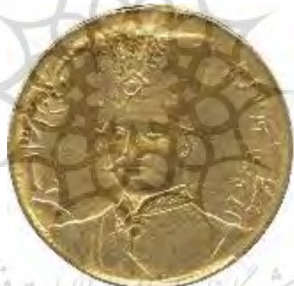
تصویر ۹: جلوس سلطنت در سنه ۱۲۶۴ ضرب ایران

هرچند به دلیل دوران طولانی سلطنت وی، القاب «ذوالقرنین» و «صاحبقران» می‌تواند صحیح باشد. به نوشته مستوفی دو نفر از پادشاهان قاجار یعنی فتحعلی شاه و ناصرالدین شاه که بیش از ۳۰ سال سلطنت کردند، خسرو صاحبقران را به سایر القاب خود افزودند و سکه‌های صاحبقرانی زدند (مستوفی، ۱۳۸۸: ۳۹۸). در قدیم پادشاهانی که ۳۰ سال پادشاهی می‌کردند خود را ذوالقرنین می‌خواندند؛ زیرا هر ۳۰ سال یک قرن حساب می‌شد، همین‌که سی سال می‌گذشت خود را ذوالقرنین و صاحبقران می‌نامیدند (فتحعلی شاه قاجار، ۱۳۸۷: ۵۶؛ موسوی، ۱۳۹۳: ۳۱). در تاریخ عضدی از ناصرالدین شاه با این القاب یاد شده است: «شاهنشاه کیوان‌خدم و دارای اسکندر حشم، وارث دیهیم جم، مالک رقاب‌الامم، السلطان بن السلطان والخاقان بن الخاقان، ناصرالدین شاه غازی، خسرو صاحبقران» (عضدالدوله، ۱۳۷۶: ۱۵).