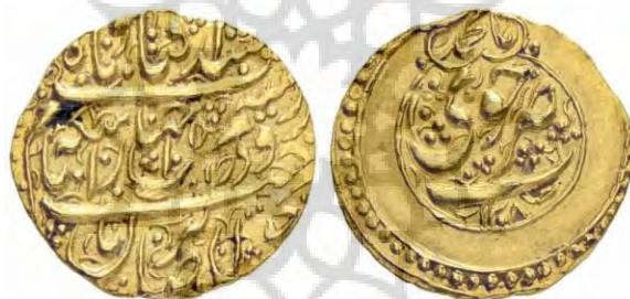
تصویر شماره ۱

و برای شگون بوده است» (مستوفی، ۱۳۸۸: ۱۱). با نگاهی به مسکوکات ضرب شده در دوره آقا محمدخان چنین به نظر می‌رسد که بسیاری از این سکه‌های ضرب شده تحت تأثیر ویژگی مسکوکات دوره زندیه است. حضور او در ساختار سیاسی و اداری دولت زندیه، عدم استقرار تشکیلات سیاسی و اداری در دوره کوتاه‌مدت وی مانع انجام تغییرات بنیادی در ضربخانه‌های این دوره گردید؛ بنابراین بسیاری از مسکوکات ضرب شده در زمان وی بر الگوی دوره سکه‌های زندیه ضرب شده‌اند. این رویه و رویکرد بر پایه حفظ سنت‌های گذشته و بیشتر بازگویی شعائر دوره زندیه است. تا زر و سیم در جهان باشد سکه صاحب‌الزمان باشد (Poole, ۱۸۸۷: ۱۴۳) بزر سکه از میمنت زد قضا بنام علی بن موسی‌الرضا (Ibid, ۱۴۳) شد آفتاب و ماه زر و سیم در جهان از سکه بحق صاحب‌الزمان «یا محمد» ضرب خوی (تصویر شماره ۱)