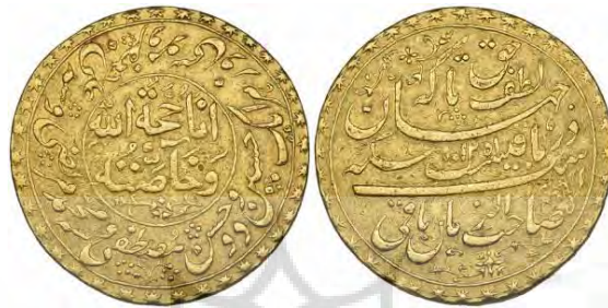
تصویر ۸: شعائر شیعی روی سکه

دوره زندیه، با شعار: لطف حق تا که در جهان باقیست / سکه صاحب‌الزمان باقیست، به تکریم صاحب‌الزمان پرداخته شده است (تصویر ۸). ویژگی تزیین حاشیه با نام ائمه از مشخصه‌های مسکوکات دوره صفویه است که در دوره فتحعلی شاه تکرار شد و در دوره محمد شاه نیز دیده می‌شود.