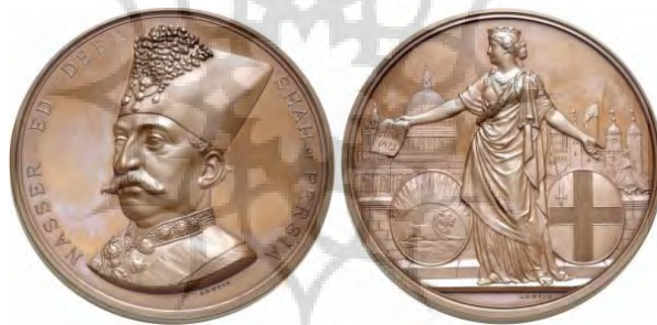
تصویر ۱۶: مدال دوره ناصرالدین شاه

تغییر رویکرد نقش و نوشتار روی سکه‌های این دوره باشد. پولیاکف روسی در سال ۱۸۹۱ م. مجوز فعالیت بانک Banque des Prets را در ایران دریافت کرد که نهایتاً در سال ۱۹۰۲ م. به بانک استقراضی روس تبدیل شد. این بانک مجوز ضرب سکه داشت (عیسوی، ۱۳۸۸: ۵۴۲-۵۴۳). این دو بانک در دوره قاجاریه زمینه گسترش نفوذ در ارکان اقتصادی و مالی کشور را به وجود آوردند؛ تا جایی که بانک شاهنشاهی افزون بر اخذ امتیاز چاپ و نشر اسکناس توانست ضرابخانه‌های دولتی را زیر نظارت خود درآورد (کرزن، ۱۳۷۳: ۱/ ۶۲۰، ۶۲۱؛ شمیم، ۱۳۷۵: ۳۹۰). البته گسترش مراودات سیاسی، اقتصادی... با کشورهای اروپایی موجب اقتباس برخی جنبه‌ها و شئونات اداری آنها در ایران شد به گونه‌ای که شکل پارچه درفش‌های ایران از مثلث به مربع تغییر یافت (ذکاء، ۱۳۴۴: ۱۴). برخی مدال‌های دوره ناصرالدین شاه این تأثیرات را به روشنی نمایان کرده‌است (تصویر ۱۶).