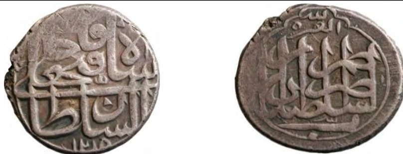
تصویر ۶: العزه لله السلطان فتحعلی شاه

( https://hcr.ashmus.ox.ac.uk/coin/hcr۱۸۵۱۶ )