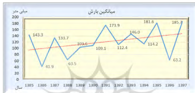
تصویر ۲. میانگین بارش در ایستگاه‌های دشت رفسنجان در دوره ۱۲ ساله (۱۳۸۵-۱۳۹۷).

۳/۹۹ بوده و اختلاف میانگین نیز عدد ۳/۴۹ را نشان می‌دهد. طبق تحلیل پرسش‌نامه، خشکسالی و کاهش آب زیرزمینی بر همه شاخص‌های مورد بررسی اثر گذار بوده است. بیشترین تأثیر خشکسالی روی شاخص‌های «کاهش میزان آب‌های سطحی» با میانگین ۴/۶۰، «افت سطح آب زیرزمینی» با میانگین ۴/۵۹ و «خشک شدن قنات، چاه و چشمه» با میانگین ۴/۴۹ بوده است. مطابق نظر پاسخ‌گویان، کمترین اثر خشکسالی روی شاخص‌های «افزایش آتش‌سوزی در محیط طبیعی منطقه» با میانگین ۲/۵۰ و «افزایش علف‌های هرز در منطقه» با میانگین ۳/۷۷ و نیز افزایش