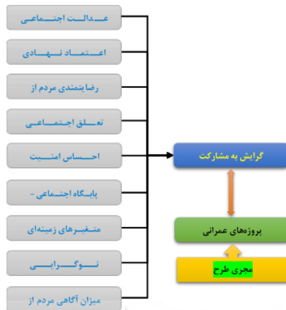
فصلنامه پژوهش‌های روستایی