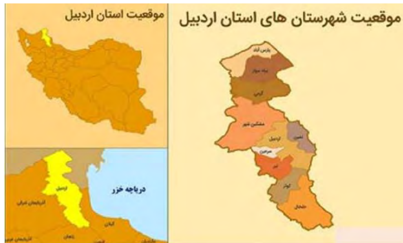
شکل ۱: موقعیت استان اردبیل

در فاز بعدی -یعنی فاز کمی- سناریونگاری صورت می‌پذیرد. همانطور که در قبل نیز توضیح داده شد، در این پژوهش به‌منظور روش سناریونویسی از منطق ادراکی بهره برده شده است. از لحاظ تعداد سناریوها از روش شوارتز استفاده می‌شود که زیرمجموعه منطق ادراکی است که ۴ سناریو ارائه می‌شود. رویکرد شوارتز یا رویکرد GBN ۱ که با عنوان "رویکرد عدم قطعیت‌های بحرانی" شناخته می‌شود، رایج‌ترین و کاربردی‌ترین روش ساخت سناریوها به شمار می‌رود (Bishop et al, 2007). در این روش با تعیین دو عدم قطعیت اصلی، فضای سناریوها در قالب ماتریسی متشکل از دو محور اصلی از دو سر عدم قطعیت‌های یاد شده تشکیل و فضای چهارگانه‌ای در قالب یک ماتریس ۲ در ۲ برای ترسیم امکان‌های آینده ترسیم می‌شود.