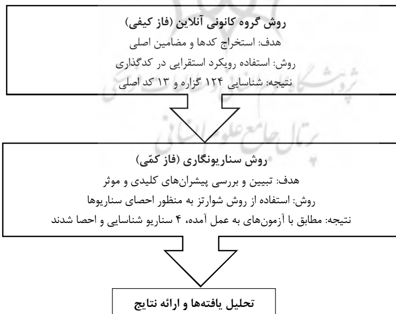
شکل ۲: مراحل روش شناسی تحقیق

در فاز بعدی -یعنی فاز کمی- سناریونگاری صورت می‌پذیرد. همانطور که در قبل نیز توضیح داده شد، در این پژوهش به‌منظور روش سناریونویسی از منطق ادراکی بهره برده شده است. از لحاظ تعداد سناریوها از روش شوارتز استفاده می‌شود که زیرمجموعه منطق ادراکی است که ۴ سناریو ارائه می‌شود. رویکرد شوارتز یا رویکرد GBN ۱ که با عنوان "رویکرد عدم قطعیت‌های بحرانی" شناخته می‌شود، رایج‌ترین و کاربردی‌ترین روش ساخت سناریوها به شمار می‌رود (Bishop et al, 2007). در این روش با تعیین دو عدم قطعیت اصلی، فضای سناریوها در قالب ماتریسی متشکل از دو محور اصلی از دو سر عدم قطعیت‌های یاد شده تشکیل و فضای چهارگانه‌ای در قالب یک ماتریس ۲ در ۲ برای ترسیم امکان‌های آینده ترسیم می‌شود.