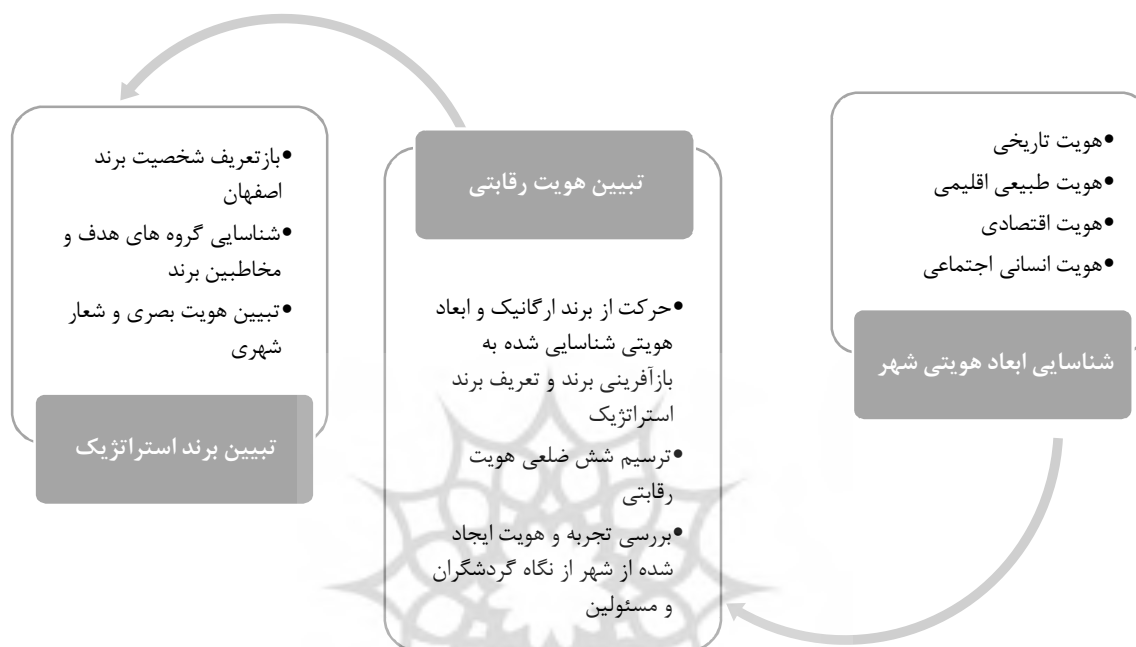
شکل ۲- خلاصه فرآیند کلی تبیین برند استراتژیک شهر اصفهان

چشم‌انداز ۱۴۰۰ شهر اصفهان تنظیم شده است (شهرداری اصفهان، ۱۳۹۵). تمامی این سندها با محوریت بر توسعه گردشگری مبتنی بر محور فرهنگ، هنر و تمدن و دیگری توسعه علم محور با هدف تبدیل شدن اصفهان به قطب علمی در کشور تدوین شده است. فرآیند طراحی برند شهر اصفهان را می‌توان در شکل شماره‌ی ۲ با عنوان خلاصه فرآیند کلی تبیین برند استراتژیک شهر اصفهان مشاهده کرد.