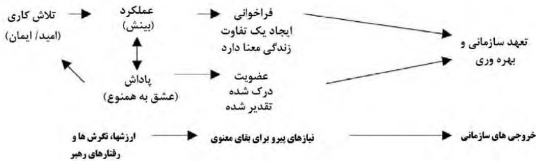
شکل (۱): مدل علی فرای (۲۰۰۳) درباره رهبری معنوی

مطابق با گراف فوق، نظریه رهبری معنوی یک چارچوب تئوریک است که در آن اقدامات، کنش‌ها، ارزش‌ها، نگرش‌ها و رفتارهای رهبران نماینده ارزش‌های سازمانی محوری می‌باشد (استروم و همکاران ۲۰۱۷). استفاده از نظریه رهبری معنوی مستلزم یک سازمانی برای خلق یک بینش است جایی که هم رهبران و هم پیروان (اعضا) یک فراخوانی برای معنادار کردن زندگی خود و سود رساندن به دیگران را تجربه می‌کنند که به صورت همزمان یک فرهنگی را بر مبنای عشق به هممنوع ایجاد می‌کنند و به موجب آن هر عضو مورد تقدیر و تحسین قرار می‌گیرد (فرای ۲۰۰۳؛ فرای، لاتام، کلینبل و کراهنک ۲۰۱۷). به عبارت دیگر، رهبران ارزش‌های معنوی را از طریق نگرش‌ها و رفتارهای خود مدلسازی خواهند کرد (فرای و همکاران ۲۰۱۷). پیروان به رهبران خود اعتماد خواهند کرد چراکه حس و درک پیروان این است که رهبران در قلب خود بهترین و بیشترین علاقه را به همه اعضا خواهند داشت. بنابراین این پیروان انگیزه دارند که تلاش خود را که به آنها معنای ذاتی می‌دهد و به زندگی هدف می‌دهد گسترش خواهند داد (آسفار، بادیر و کیانی ۲۰۱۶؛ چن و یانگ ۲۰۱۲). رهبری معنوی نهایتاً "هم یک رهبر و هم یک پیرو را از نظر سازمانی متعهدتر و مولدتر خواهد ساخت (چن و یانگ ۲۰۱۲؛ استروم و همکاران ۲۰۱۷).