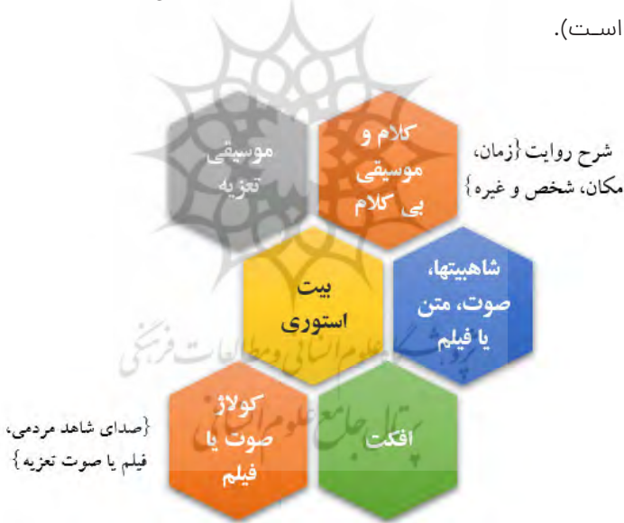
نمودار ۲. طراحی الگو

الگوی پیشنهادی قالب ابداعی بیت‌استوری، به شرح ذیل می‌باشد (که قابل پیشرفت است).