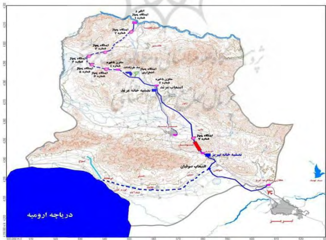
شکل شماره ۲- طرح انتقال آب ارس به تبریز و دریاچه ارومیه

یکی از آثار فروپاشی اتحاد جماهیر شوروی، کاهش عملی سهمیه ایران از آب ارس به‌رغم توافق‌نامه‌ها و شیوه‌نامه‌های موجود میان ایران و شوروی است که در آنها بر بهره‌برداری مساوی از آب‌های مرزی از جمله ارس، تأکید شده است. علت این امر، ظهور دو کشور ارمنستان و جمهوری آذربایجان در ساحل ارس است که هر یک از حق بهره‌برداری ۵۰ درصدی از آب ارس برخوردارند و لذا سهمیه ایران در مقایسه با قبل از فروپاشی اتحاد جماهیر شوروی بسیار کاهش یافته است تا جایی که گفته می‌شود سهم ایران به یک‌سوم کاهش پیدا کرده است (پاک‌نژاد و همکاران، ۱۳۸۹: ۹۴). علیرغم این، جمهوری آذربایجان و ترکیه با طرح انتقال آب ارس به دریاچه ارومیه مخالفت کرده‌اند. به‌رغم این، رسانه‌های این دو کشور طی یک دهه اخیر پروپاگاندای سیاه علیه ایران به دلیل خشک شدن دریاچه ارومیه راه انداخته‌اند.