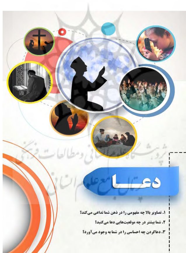
شکل (۳): صفحه عنوان درس