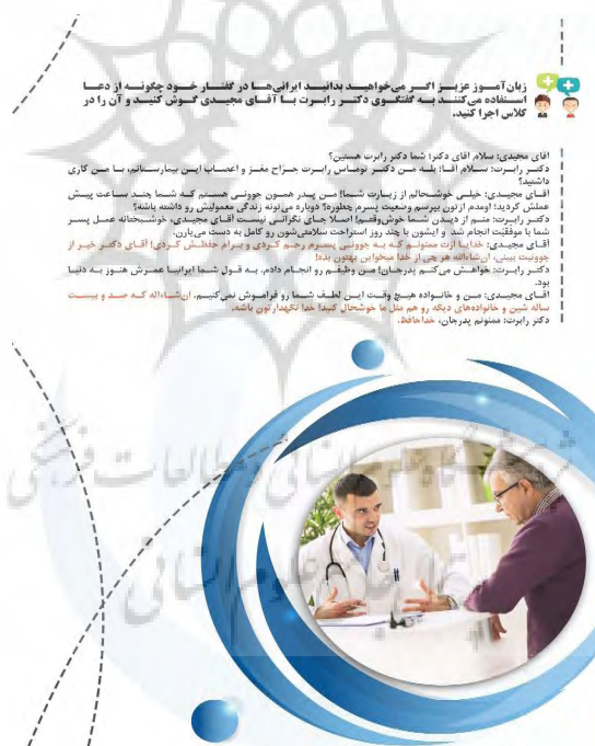
شکل (۴): گفتگوی شماره یک (اتاق دکتر رابرت) ۱

در گام نخست به منظور آماده کردن ذهن زبان آموزان با موضوع درس، از تصاویر مرتبط با عمل دعا کردن در فرهنگ‌های مختلف استفاده شده است. همچنین با در نظر گرفتن این تصاویر به درگیر کردن حس دیداری آنان و به تبع آن تولید هیجان مثبت جامعه عمل پوشانده شده است. در گام بعد، پرسش‌هایی به منظور برقراری پیوند تجربیات شخصی زبان آموزان با موضوع درس و ایجاد هیجان مثبت در آنان طراحی شده است. از سوی دیگر، این پرسش‌ها موجب پرورش مهارت تفکر در آنان می‌گردد. از این‌رو مدرس برای شروع درس از زبان آموزان در ارتباط با تصاویر و پرسش‌ها نظرخواهی کرده و بازخورد مناسب ارائه می‌دهد و در جمع‌بندی بحث نیز موضوع کلاس را به سمت مبحث دعا در میان فارسی‌زبانان هدایت می‌کند.