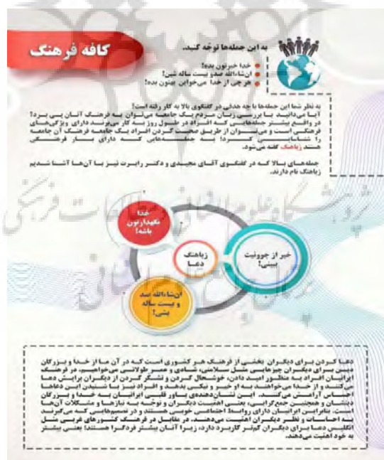
شکل (۶): توضیح فرهنگ نهفته در زیاهنگ دعا

پس از ارائه گفتگو، در این بخش تمرینی با هدف پرورش تفکر خلاق زبان آموزان طراحی شده است که بر اساس این تمرین آنان باید در قالب یک فعالیت گروهی به کشف پاره گفتارهای مربوط به زیاهنگ دعا در جدول پردازند. به منظور درگیر کردن حواس آنان نیز بیشتر عبارات مانند «ساز زندگی شاد»، «کیفتون کوک»، «گل خنده رو لباتون» دارای وزن حسی می باشند؛ در واقع، در دو عبارت اول به جای استفاده از عبارت «زندگی شادی داشته باشید» از واژه های «ساز» و «کوک» بهره گرفته شده است تا صدای ساز و تصویر آن را نیز در ذهن متبادر کند و به جای آوردن «همیشه شاد باشید» عبارت «گل لبخند رو لباتون» لبخند به گل تشبیه شده و تصویر و عطر گل را نیز برای فراگیر به ارمغان می آورد که این امر تولید هیجانات مثبت را نیز با خود به همراه دارد. این امکان برای مدرس وجود دارد که این تمرین را به صورت مسابقه در کلاس اجرا کند و گروهی که عبارات بیشتری را کشف کرد به عنوان برنده معرفی نماید.