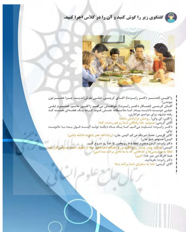
شکل (۸): گفتگو در مهمانی ۱

از آنجا که دعا مقوله‌ای بین‌المللی و بینافرهنگی است و در همه فرهنگ‌ها به اشکال و عبارات گوناگون وجود دارد، در این بخش با مقایسه تطبیقی پاره‌گفتارهای آن در فرهنگ زبان‌های مبدأ (عربی و انگلیسی) با زبان فارسی، به اهمیت جایگاه هیجانات مثبت در یادگیری توجه شده است. همچنین در تمرین بعد با طراحی یک موقعیت، با پیش‌بینی و طراحی مسیر درست توسط زبان‌آموزان به پرورش تفکر آینده‌نگر آنان پرداخته شده است. همچنین افزون بر پرورش تفکر آینده‌نگر، به آنان نشان داده می‌شود که یک مفهوم را می‌توان به دو گونه دارای بار هیجانی مثبت و منفی بیان کرد و انتخاب درست آن در موقعیت‌های مختلف به دلیل تأثیری که بر مخاطب می‌گذارد، بسیار حائز اهمیت است.