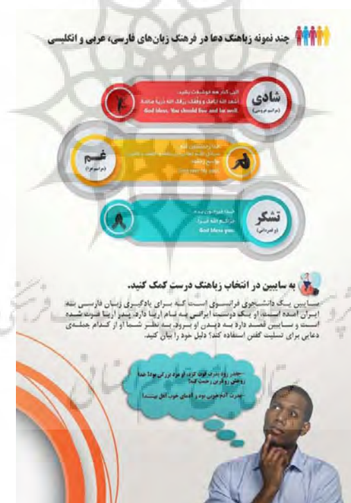
شکل (۲): تمرین تفکر آینده نگر ۲

در این بخش از درس، پس از آشنایی نسبی زبان آموزان با پاره گفتارهای مربوط به دعا و کاربرد آن در میان فارسی زبانان، به معرفی زیاهنگ دعا و فرهنگ نهفته در این زیاهنگ پرداخته شده است؛ به این صورت که با بیان پاره گفتارها این تفکر در ذهن زبان آموزان به وجود آورده می شود که با چه هدفی از این عبارات استفاده می شود و بعد از جمع بندی نظرات آنان فرهنگ نهفته در این عبارات توضیح داده می شود. همانطور که در متن قابل مشاهده است، این زیاهنگ به اعتقادات ایرانیان و فرهنگ جمع گرایی ۱ موجود در میان آنان اشاره دارد؛ در جوامع جمع گرا توجه به دیگران و روابط انسانی بسیار اهمیت دارد و شایسته است مدرس این بخش از درس را در کلاس به بحث و گفتگو بگذارد تا منجر به درک کامل زبان آموزان شود.