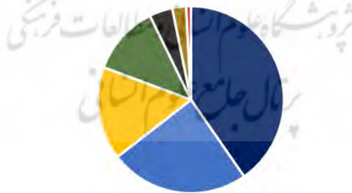
نمودار ۱. به‌کارگیری هر یک از تکنیک‌های هفت‌گانه توسط مترجم

قرض‌گیری ■ گرت‌برداری ■ تحت اللفظی ■ تغییر صورت ■ تغییر بیان ■ معادل‌یابی ■ همانندسازی