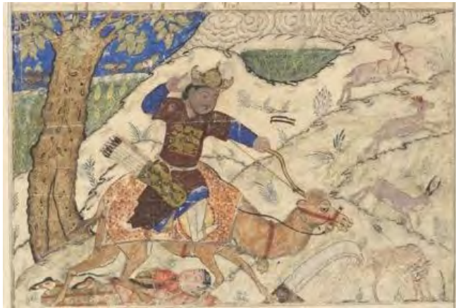
۷- عدم نمایش هاله فرّ در نگاره کشتن آزاده به دست بهرام گور، کتابخانه دانش‌گاه هاروارد، شماره ثبت ۱۹۷۵، ۱۹۳

در نگاره «سخن گفتن بهرام گور با نرسی» فرّ ایزدی با سه نمود متفاوت نشان داده شده است: هاله نور، تاج، دستارچه (تصویر ۸). تاج یکی از نمادهای فرّ ایزدی است. طبق نظر دوبوکور شکل مدور تاج، به دایره نورانی دور سر قدیسن (هاله نور) شبیه است. دوبوکور شکل مدور تاج را با کهن‌الگوی دایره مرتبط می‌داند و از تاج با عنوان «طوق اقتدار» یاد کرده و تصریح می‌کند که تاج، زینت‌بخش برترین اندام آدمی [سر فرمانروای جسم] و زیوری آسمانی است، به همین جهت نشانه سلطنت، شوکت و حشمت خسروی و نشان افتخار تاجدار محسوب می‌شود. فلزات گران‌بها و در و گوهری که تاج با آن ساخته شده، به تاج‌دار قدرتی فوق‌زمینی می‌بخشد، همچنان که برگ و گیاهی که بر سر پیکره‌های خدایان باستان نهاده شده (ژئوس: بلوط، آپولون: خرزهره، بن دیونیزوش: تاک) نماد نیروهای فوق‌طبیعی به‌شمار می‌رود (دوبوکور، ۱۳۷۳: ۹۷-۸). در شاهنامه از فره‌مندی تاج و کلاه یاد شده است (ماهوان و دیگران، ۱۳۹۴: صص ۱۱۹-۱۵۷):