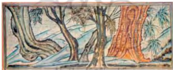
۱۵- درخت مقدس بودا، جامع النواربخ، ۷۱۴ ه.ق، مکتب تبریز

ابر در نقاشی چینی به صورت موج و پیچ‌درپیچ ترسیم می‌شود و همین تصویر به نگارگری ایرانی راه یافته است. ابر از اجزاء مهم در نگارگری ایرانی است به گونه‌ای که آن را یکی از شاخه‌های هفت‌گانه (خطایی، فرنگی، فصالی، ابر، واق، گره) این هنر دانسته‌اند و عبدی‌بیگ شیرازی (۹۸۸-۹۲۱ ه.ق) در وصف آن چنین سروده است (ذکاء، ۱۳۶۷: ذیل ابر):