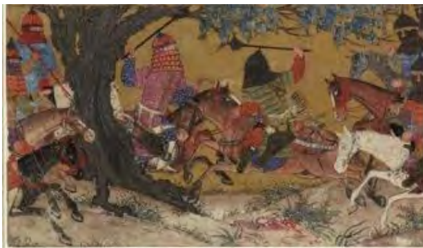
۱۳- نبرد اردشیر و اردوان، شاهنامه دموت، موسسه هنری دیترویت، شماره ثبت ۳۵،۵۴