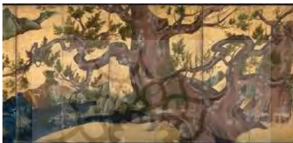
۱۴- تنه درختان در نقاشی چینی