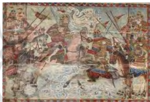
۱۹- کشته شدن فور به دست اسکندر، موزه هنری دالاس، شماره ثبت ۱۴۰۱۴۰۳۹۰