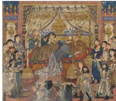
۲۷- زاری بر مرگ اسکندر، گالری هنری فریر، شماره ثبت ۱۹۳۸،۳.