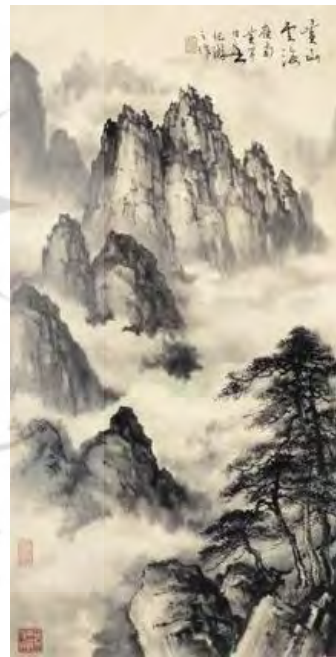
۱۶- صخره‌های تیز و ابرهای موج، نقاشی چینی

۱۷- صخره‌های تیز، شاهنامه دموت، بیرون آمدن اسکندر از ظلمات موزه هنری دالاس، شماره ثبت ۲۰۱۴.۱، ۲۸۹