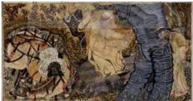
۱۲- رستم و شغاد، شاهنامه دموت، موزه بریتانیا، شماره ۱۹۴۸. ۱۲۱۱