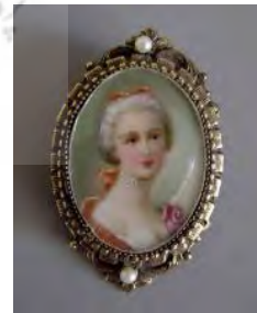
۱- مینیاتور اروپایی، تک‌چهره روی عاج