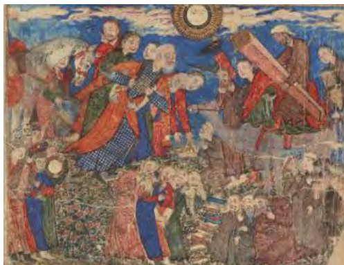
۲۵- سوگ‌واری فریدون بر تابوت ایرج، گالری هنری فریر، شماره ثبت ۱۹۸۶.۱۰۱