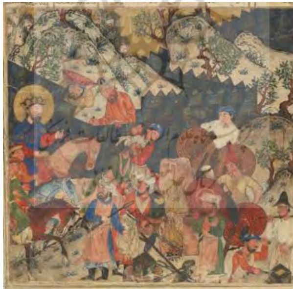
۴- اسکندر سد آهنین را می‌سازد، گالری هنری فریر، شماره ثبت ۱۹۸۶، ۱۰۴

ستوده، زبردست، پرهیزگار، کارگر، چیست را که برتر از سایر آفریدگان است» (همان: ۳۲۱). بارزترین نمود تصویری فرّه، هاله نور است، نظیر هاله نور گرداگرد سر حضرت مریم مقدس و ائمه اطهار که شاهدی بر قداست آنان است و شاید برداشتی از آیین مهرپرستی در ایران باشد. هاله نور ریشه در پرستش خورشید و نور در تمدن‌های کهن دارد اما نوع، رنگ، اندازه و شکل دایره‌ای با سه خط به جهت بالا، چپ و راست ترسیم می‌شود که نور دور سر حضرت مسیح گاه به شکل دایره‌ای با سه خط به جهت بالا، چپ و راست ترسیم می‌شود که به تثلیث اشاره دارد (بایرامزاده و احمدی، ۱۳۹۵: ۶۶). در متن‌های آشوری، این نیرو را معمولاً مَلَمّو ۱ می‌خوانند که «درخشش پرهیبت» معنا می‌دهد و احتمالاً اصطلاحی رایج در جنوب بین‌النهرین و حتا مقدم بر عصر سومریان است. مَلَمّو را با پرتوهای تابان یا هاله‌های درخشان و پرهیبت بر گرد سر شاهان، به نشانه حرمت و تقدس نشان می‌دادند. مَلَمّو حامی شاه و دور دارنده دشمنان وی بود، اما اگر شاهی حمایت الهی را از دست می‌داد، مَلَمّو از او گریزان می‌شد و وی در برابر دشمنان بی‌دفاع می‌ماند (بهار، ۱۳۷۵: ۴۳۷). در نگاره‌های شاهنامه دموت پادشاه با هاله فرّ ترسیم شده تا تأکیدی بر مشروعیت او از جانب اهورامزدا باشد. لازم به ذکر است که هاله نور در نقاشی چینی هم کاربرد دارد و می‌تواند از این طریق به شاهنامه/یلخانی راه یافته باشد (تصویر ۴).