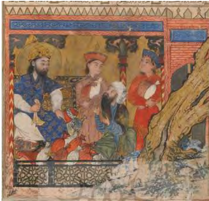
۹- بخشش انوشیروان، گالری هنری فریر، شماره ثبت ۱۹۴۲،۲