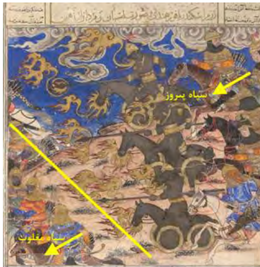
۲۱- نبرد سیاه اسکندر با هندیان، کتابخانه دانش گاه هاروارد، شماره ثبت ۱۹۵۵، ۱۶۷