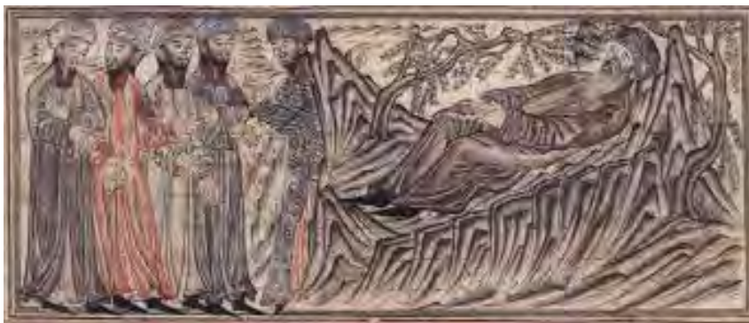
۱۸- صخره‌های تیز، نگاره جامع‌التواریخ