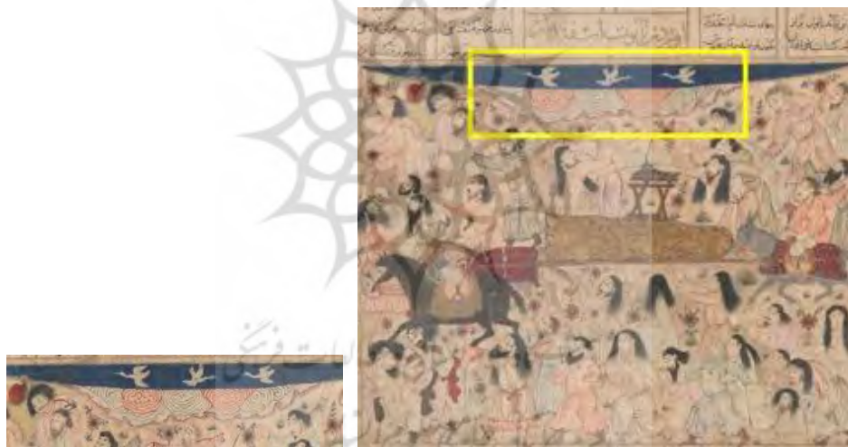
۲۳- تشییع جنازه اسفندیار، موزه متروپولیتن، شماره ثبت ۳۳،۷۰.

های مغولی را می‌بینیم که گیسوان را افشان کرده و در چهار ردیف گرداگرد تابوت اسفندیار را فراگرفته‌اند. تابوت طلایی رنگ اسفندیار را سه اسب حمل می‌کنند. جامه سوگواران رنگ آمیزی نشده و فقط با ظرافت قلم‌گیری شده است تا از سویی بر فضای حزن‌آلود سوگ تأکید بیشتری داشته باشد و از سوی دیگر فقط تابوت طلایی رنگ اسفندیار و اسب‌های حامل آن در مرکز توجه قرار گیرد. در بالای تصویر ابرهای پیچان به سبک نقاشی چینی و در دو رنگ آبی و قرمز به تصویر درآمده است. کاربرد رنگ قرمز برای ابر از نوادر است و می‌تواند تأکید بر خون رنگ بودن آسمان و نماد سوگ باشد. سه درنا ی سپید در پس‌زمینه آسمان صاف آبی در حال پرواز هستند. درنا از پرندگانی است که در هنر تزئینی چین نمونه‌های فراوانی از آن دیده می‌شود و می‌توان آن را از نقوش وارداتی هنر چین به ایران دانست. طبق نظر محققان (طالب‌پور، ۱۳۸۷: ۲۲) درنا در هنر چین نماد طول عمر است و در این جا می‌تواند نماد عمر کوتاه اسفندیار باشد (تصویر ۲۳)