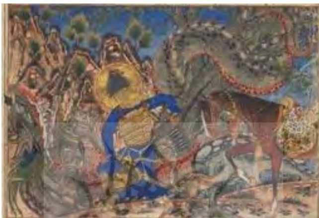
۵- هاله فرّ در نگاره نبرد بهرام گور با گرگ شاخدار، کتاب‌خانه دانش‌گاه هاروارد، شماره ثبت ۱۹۶۰، ۱۹۰

بهرام گور در نگاره‌های «کشتن گرگ شاخدار» (تصویر ۵) و «کشتن اژدها» (تصویر ۶) با هاله نورانی فرّ ترسیم شده، زیرا اژدها و گرگ هر دو نمادهای اهریمنی هستند و پیروزی نیروهای اهورایی بر اهریمن نشان‌دهنده مشروعیت شاه و فرمندی اوست. اما در نگاره‌ای که بهرام آزاده را در زیر پای چارپا می‌کشد، بهرام فاقد هاله نور ترسیم شده گویا نگارگر چنین تعبیر کرده که این عمل کرد بهرام، اهورایی نیست و گویی فرّه در این نگاره از وی گسسته است (تصویر ۷).