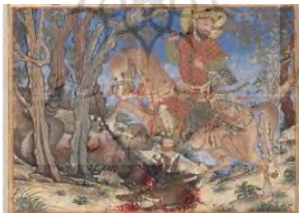
۶- هاله فرّ در نگاره نبرد بهرام گور با اژدها، موزه کلوند، شماره ثبت ۱۹۴۳، ۶۵۸