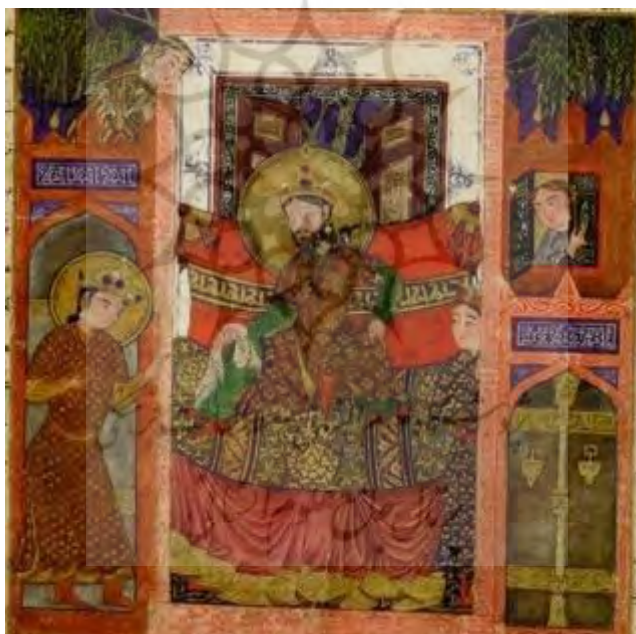
۸- سخن گفتن بهرام گور با نرسی، مجموعه ناصر خلیلی، شماره ثبت ۹۹۴

تلفیق سه نماد فرّه ایزدی هاله نور، تاج و دستارچه در نگاره «بخشش انوشیروان» در شاهنامه ایلخانی دیده می‌شود که می‌تواند تأکید مضاعف بر اهورایی بودن این بخشش و برجسته‌سازی این عمل‌کرد باشد (تصویر ۹).