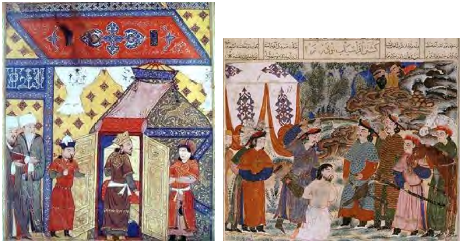
۱۰- چهره‌های مغولی، شاهنامه دموت، کشته شدن نوذر به دست افراسیاب، مجموعه نلسون آتکینز، شماره ثبت ۱۰۳-۵۵

۱۱- چهره‌های مغولی، جامع‌التواریخ، گرویدن غازان خان به اسلام