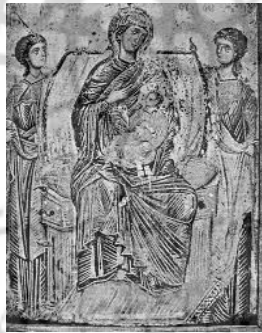
۲۹- نقاشی بیزانس، نمایش چین و شکن لباس