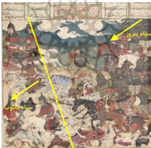
۲۲- جنگ رشنواد با رومیان، کتابخانه دانش گاه هاروارد، شماره ۱۹۱۹، ۱۲۰