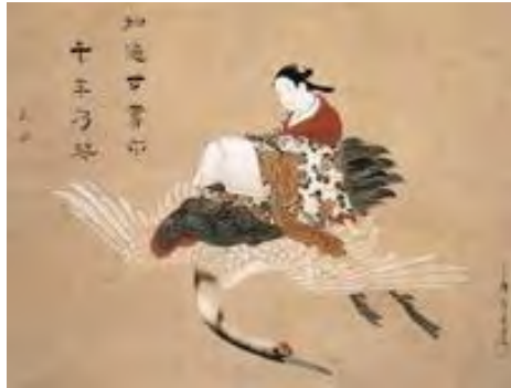
۲۴- تصویر درنا در نقاشی چین

ترکیب‌بندی این نگاره براساس نسبت طلایی است به‌گونه‌ای که تابوت اسفندیار که موضوع اصلی نگاره است در مرکز تصویر و اسب بدون سوار ولی در یک سوم چپ دیده می‌شود. نگارگر با گردش اسپیرالی نگاه مخاطب را بر همهٔ عناصر تصویر چرخش می‌دهد. این نگاره شامل ۳۵ پیکره است که همگی بدون دستار و با گیسوان پریشان تابوت اسفندیار را دنبال می‌کنند (بهلول و دیگران، ۱۳۹۷: ۸۶).