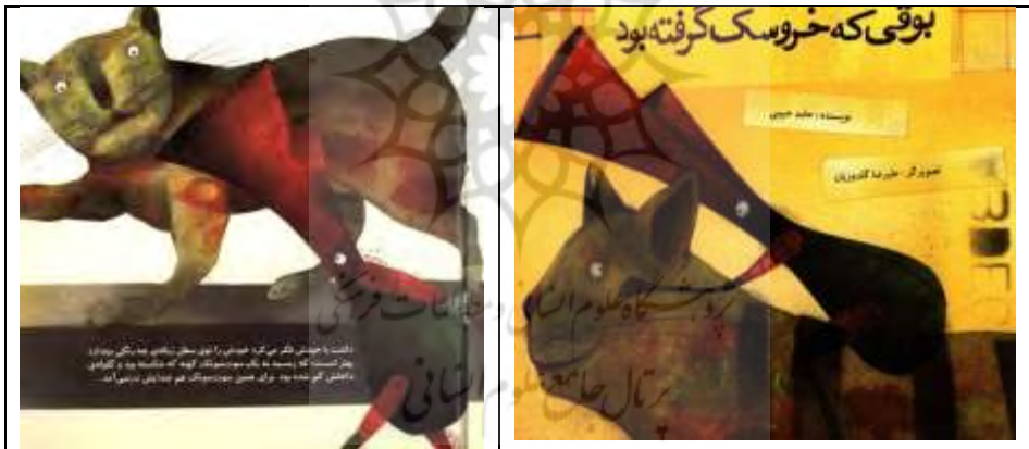
تصویر شماره هشت

درون‌مایه داستان، بازنمایی رانۀ تفرّد است. یونگ روند فردانیت را چنان طبیعی و به حدی نیرومند می‌انگارد که آنرا رانه (غریزه) می‌نامد. (شولتز ۱۳۵۹: ۷۵) رانۀ تفرّد ابتدا فرد را به سوی گسیختگی روانی هدایت می‌کند. (حر و همکاران ۱۳۹۶: ۶۰) گربه‌ای که بر تصویر روی جلد کتاب نقش بسته و بوق را بر دوش سوار کرده است و به پیش می‌راند، می‌تواند نمادی برای بازنمایی رانۀ تفرّد باشد. با توجه به اینکه مقصد گربه سطل آشغال است، بنابراین گربه (رانۀ تفرّد) بوق سَرخورده را با خود به سمت سطل زباله (به سمت ناخودآگاهی که منبع پس‌ماندها و پس‌راندهاست) هدایت می‌کند. متن نوشتاری داستان، هیچ صحبتی درباره این گربه نمی‌کند، اما در متن تصویری کتاب، به قدری این گربه نشانگر درون‌مایه داستان (تفرّد) است که به عنوان تصویر روی جلد نیز قرار گرفته است.