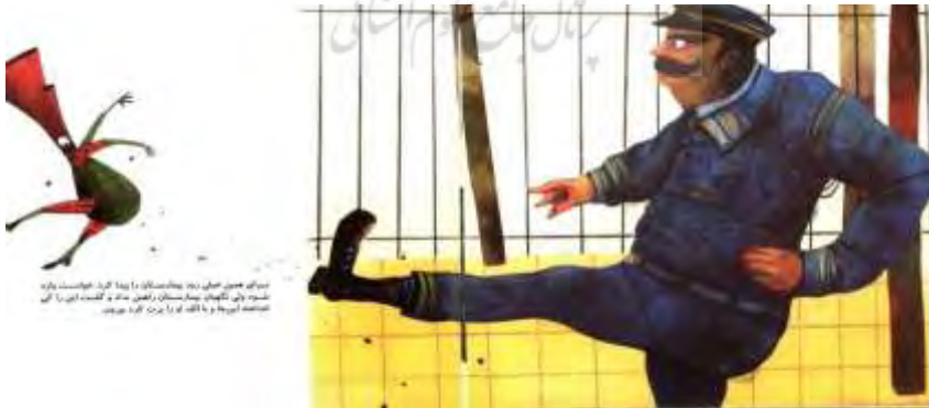
تصویر شماره چهار

همین اساس ایشان علاوه بر سایه فردی، ایضاً قائل به سایه جمعی است. بیمارستان نمادی از جامعه متمدن است. این جامعه متمدن داعیه حمایت و درمان بیماران را دارد، اما این ادعا تنها ظاهر امر (نقاب یا پوشش دروغینی) است. واقعیت پنهان را باید در سایه جمعی آن (نگهبان بیمارستان) یافت. نگهبان بیمارستان، بیمار (بوق) را بی‌ارزش می‌شمارد و او را سرکوب می‌کند. بی‌ارزش تلقی کردن‌های بیمار از سوی نگهبان چیزی جز فرافکنی صفات منفی مستتر در سایه جمعی نهاد بیمارستان (روح جمعی زمان) نیست. نگهبان بیمارستان (سایه جمعی) همان کنشی را روی بوق انجام می‌دهد که مرد بیکار مزاحم (سایه فردی) انجام داده بود؛ یعنی هر دو با لگد، بوق را طرد می‌کنند. تصویر نگهبان و تصویر مرد مزاحم، هر دو با سبیل‌های کلفت، ابروهای پرپشت و اخم‌آلود و خشونت مشابهی بازنمایی شده است. تنها تفاوت آن‌ها در این است که لباس فرم نگهبان و نحوه لگدزدن اتوکشیده‌اش بیانگر خشونت سازمان‌یافته نهادهای اجتماعی است، ولی پیراهن مرد نامتمدنی که یک گوشه‌اش داخل شلوار و یک گوشه‌اش بیرون است، بیانگر خشونت فردی و غیرسازمان‌یافته. بوق خواهان پذیرفته شدن توسط دو چرخه (نقاب فردی مدرنیته) و خواهان ورود به بیمارستان (نقاب جمعی جامعه مدرن) است، اما مواجهه با سایه (نگهبان بیمارستان و مرد مزاحم) عامل دوری از نقاب و شوت شدن به سوی مسیر تفرّد و استعلای هویت می‌شود. به اعتقاد یونگ، مسیر تفرّد همواره با پذیرش رنج مواجهه با سایه آغاز می‌شود. (اسنودن ۱۳۹۸: ۱۱۱)