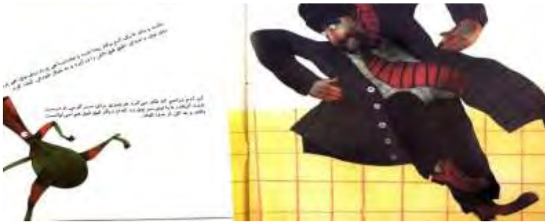
تصویر شماره سه

شد و جفت‌پا هی پرید روی بوق، هی پرید روی بوق، و صدای قیق‌قیق‌اش را درآورد و به خیال خودش کیف کرد. آن آدم مزاحم که فکر می‌کرد هر چیزی برای سرگرمی او درست شده، آن‌قدر با پا توی سر بوق زد که او دیگر قیق‌قیق هم نمی‌توانست بکند و به کل از صدا افتاد.» (حبیبی ۱۳۸۷: ۹) یونگ این کارکرد سایه را با عنوان «کارکرد جبرانی» براساس اصل تعادلی حیات تبیین می‌کند. وفق اصل تعادلی حیات «هر وقت یک فرایند روانی، ما را بیش از حد در مسیری پیش می‌برد؛ روان ما در صدد برمی‌آید تعادل را بازگرداند. حتی رابطه خودآگاه و ناخودآگاه هم بر اساس همین اصل عمل می‌کند.» (اسنودن ۱۳۹۸: ۱۰۳) بنابراین وقتی نقاب (دوچرخه) در جهت ارج نهادن به صدای بوق، بوق را بر فراز فرمان می‌نشانند؛ وفق اصل تعادلی حیات، سایه (مرد مزاحم) از توی ناخودآگاه سر بر می‌آورد و صدای بوق را زیر پا خفه می‌کند. سایه در کالبد یک شخص سطح پایین و شمایل بدوی و نامتمدن با کیفیاتی دل‌ناپذیر تجسم می‌یابد. (فوردهام ۱۳۹۳: ۸۲) از همین رو، مرد مزاحم (سایه) سبیل‌ها و ابروهای پرپشت، خشن، ظاهری نامتمدن و بدوی دارد و هراسی در دل بوق افکنده است که باعث شده بوق از او بگریزد. تصویری که از بوق در مواجهه با شخصیت سایه (مرد مزاحم) ترسیم شده است، بوقی را نشان می‌دهد که زیرچشمی و با اضطراب به مرد نامتمدن پشت سرش (به سایه‌اش) نگاه می‌کند و دوان‌دوان سعی در گریختن دارد. تصویر مذکور گویای نامطلوب‌انگاری ناخودآگاهانه و عدم پذیرش کهن‌الگوی سایه است. «در چنین حالتی باید چنین بیندازیم که در حقیقت ما به کیفیتی از شخص خود که در شخص دیگری آنرا می‌یابیم، مهر نمی‌ورزیم.» (فوردهام ۱۳۹۳: ۸۲)