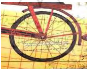
تصویر شماره یازده

شکل هندسی دایره، نماد تکرار است و تأکید بر نمایش ابژه‌های دایره‌ای شکل در تصاویر آغازین و پایانی کتاب نیز هم‌راستا با همین الگوی روایی دایره‌ای است. دو دایره به شکلی پرننگ در روایت تصویری داستان در کانون دید قرار دارد: یکی در قالب دایره چرخ دوچرخه، در آغاز داستان و دیگری به شکل دایره تابلوی بوق‌زدن ممنوع، در پایان داستان. چرخ‌های دوچرخه نماد تکرارند، اما بر تکرارهایی پیش‌رونده و پویا دلالت دارند، نه تکرارهای درج‌ازنده و ایستا. چراکه چرخ‌های دوچرخه علاوه بر حرکت دورانی و تکراری، دارای حرکت خطی (حرکت به سمت جلو) نیز هستند که نمادی از حرکت قهرمان داستان در مسیر خطی فردانیت است. کوپر در «فرهنگ نمادها» (۱۳۹۸: ۱۱۶) پره‌ها و شعاع‌های داخل چرخ (قاچ‌های روی دایره) را نماد دوره‌های مختلف حیات می‌انگارد که با گردش چرخ مدام جایگاهشان تغییر می‌کند.