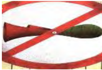
تصویر شماره دوازده

از منظر یونگ، هدف تمام مسیرهای تفرّد سرانجام ختم می‌شود به مرکز ماندالا که جایگاه خویشتن و نقطه اتصال با مبدأ انسان و مبدأ عالم است. (شایگان ۱۳۵۵: ۱۹۳). استقرار بوق در مرکز این ماندالا، نشان از استقرار «خویشتن» در جایگاه قدرت است. حرکت دایره‌ای «من» حول این مرکز اقتدار، معنایی نوین می‌یابد. (یونگ ۱۳۹۷: ۱۴۱)