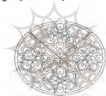
تصویر شماره هفت: ماندالا

ماندالاها (مَندَل‌ها) دوایری هستند که بر اشکال دیگر (مثل مربع، صلیب، ضربدر) محاط‌اند.