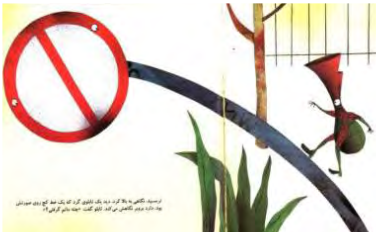
تصویر شماره دو