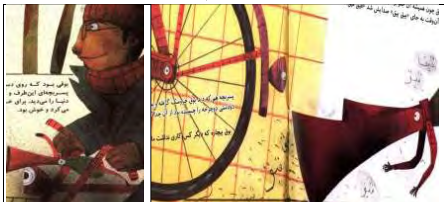
تصویر شماره یک

تک‌تک اجزای دوچرخه نظیر چراغ جلو، چراغ عقب، بوق و چرخ‌های دوچرخه که کنش یا دیالوگی در داستان ندارند) چشم‌های جداگانه‌ای گذاشته است.