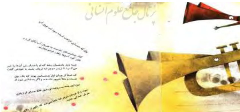
تصویر شماره پنج

سوت‌سوتک، صدای مرشدی در ناخودآگاه است. سوت‌سوتک با اشاره‌ای رمزی بوق را به سوی بیمارستان راهنمایی می‌کند، اما نمی‌گوید: درمان بوق در داخل بیمارستان (در خودآگاه جمعی) محقق می‌شود یا در بیرون از آن (در ناخودآگاه جمعی و در قالب تابلوی کنار بیمارستان). جامعه ذهنی بوق، شامل شهروندانی نظیر بوق، سوت‌سوتک، فلوت، شیپور و سایر سازهای بادی است. سوت‌سوتک فرد کوچکی از این جامعه است، در نقطه مقابل، شیپور شخصیتی بزرگ، خواستنی و آرمانی. تصویرگری شیپور از زاویه دید بوق صورت گرفته است. در همین راستا، بزرگ‌پنداری نه تنها از طریق بزرگی اندازه تصویر که از شیپور کشیده شده، نمایان است، بلکه از طریق تایپوگرافی (انتخاب فونت و نحوه چینش و تایپ واژه‌های مقابل دهانه شیپور) نیز بازنمایی شده است. در واقع، تایپوگرافی (سیمامعنایی) کلمات مقابل دهانه شیپور، خروج صدایی مقتدر و بلند را از دهانه شیپور می‌نمایاند. در پایان تلویحاً مشخص می‌شود که برخلاف تصور بوق، پیر خردمند بودن به بزرگی ظاهری و بلندی صدا (صدا به‌عنوان یکی از متعلقات نقاب بوق) نیست، بلکه به جدیت در بازجستن گمشده‌ها و فقدان‌های خودآگاه (جستجوی گلوله درون سوت‌سوتک) و به قول مولانا جستجوی «آنچه یافت می‌نشود» (آنچه در دسترس خودآگاه نیست) است.