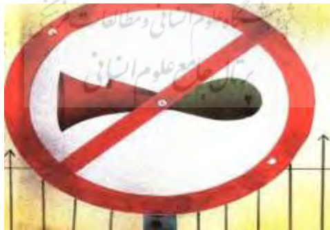
تصویر شماره شش

می‌کند. «بوق که مدت‌ها بود کسی محلش نگذاشته بود، برای تابلو درد دل کرد و گفت که صدایش را از دست داده. تابلو گفت: همه مشکل دارند. همین من رو می‌بینی؟ یک تابلوی ممنوعم ولی یادشان رفته رویم بکشند که چی ممنوعه. برای همین من هم به درد نمی‌خورم.» (حیبی ۱۳۸۷: ۲۰) درد دل و ابراز همدردی تابلوی ممنوع، از شاخصه‌های زبان زنانه است. بعد از اینکه بوق به وصال با تابلو نائل می‌شود، عاشقانه‌نگی نگاه در مردمک‌های چشمان تابلو (که به سمت بوق آرمیده در مرکز تابلو خیره است) موج می‌زند و عشق از لبخند رضایتش (که در تصویر کتاب، گویی به پهنای صورتش نقش بسته) مشهود است. این نگاه عاشقانه در عین اینکه رنگی از عشق به جنس مخالف را دارد، بویی از مادرانگی نیز دارد. چراکه وقتی بوق در آغوش تابلو می‌آرمد، احساس ناامنی و اضطراب‌هایی که در تصاویر قبلی داشته (هنگام فرار از مرد مزاحم، هنگام به زمین خوردن در پشت سر دوچرخه، هنگام شوت شدن توسط نگهبان)، از میان می‌رود. چراکه تابلو با دایره قرمزش بر دور بوق حصار امن ایجاد می‌کند و هشدار تحذیر (علامت ورود ممنوع) را بر همگان اعلام می‌دارد. بدین ترتیب، بوق حریم امنی از آغوش مادرانه را در گرد خود احساس می‌کند. «اغلب اوقات در اولین مراحل رؤیاها آنیما و آنیموس با کهن‌الگوی مادر و پدر در می‌آمیزد.» (رابرتسون ۱۳۹۹: ۱۵۳) ایجاد حفاظ دایره در مراقبه‌ها، ریاضت‌های مرتاض‌ها و طلسم‌ها پیشینه‌ای کهن‌الگویی دارد.