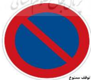
تصویر شماره نه: توقف ممنوع

حضور فراوان نمادهای حرکت (چرخ‌های دوچرخه، گربه‌ای که رو به جلو گام برمی‌دارد، جریان آب جوی در کنار بیمارستان، نمو گیاهان و درختان کنار جوی، بالا رفتن مورچه‌وار بوق از تابلو) همگی مبین فرایندی بودن تفرّد و پویایی هستند. حتی تابلوی ممنوعه (تا قبل از دگردیسی به بوق‌زدن ممنوع) مبین حرکت است و بوق را به عدم توقف فرامی‌خواند، همچنین شکل و شمایل تابلوی مذکور، هم‌ریخت است با تابلوی معروف «توقف ممنوع» (دایره‌ای قرمز با یک خط مؤرب داخلی).