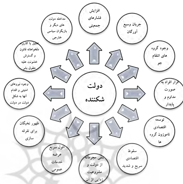
نمودار شماره ۱: مدل مفهومی دولت شکننده

( https://fragilestatesindex.org/country-data/ (2019) & Gould and Pate, 2016)