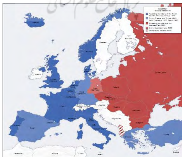
«تقابل شرق با غرب و آغاز جنگ سرد بلافاصله بعد از اتمام جنگ جهانی دوم»

بنابراین می توان گفت طرح مارشال با هبه اقتصاد سرمایه داری به اروپای غربی نه تنها موجب تسلط اقتصادی آمریکا و سلطه دلار بر قاره سبز شد، بلکه آمریکا در عوض کمک های مالی اجازه ایجاد پایگاه های نظامی در اروپا پیدا کرده و عملاً با تسلط اقتصادی و نظامی، اروپا زیر چکمه های آمریکا قرار گرفت. از طرفی طرح پیمان اتلانتیک شمالی موسوم به ناتو در سال ۱۹۴۹ در واشینگتن به تصویب رسید و با توجه به اینکه ۷۰ درصد بودجه این ارتش توسط آمریکا تأمین می شود، ناتو تحت سیطره و نفوذ آمریکا قرار گرفت. مقر ناتو در بروکسل، مرکز اتحادیه اروپا می باشد و سبب شده است آمریکا در وسط اروپا، حضور نظامی چشمگیری داشته باشد. آمریکا در حال حاضر، ۲۷۰ پایگاه نظامی در آلمان، ۸۳ پایگاه نظامی در ایتالیا و در اسپانیا، پرتغال، هلند، انگلیس، فرانسه، بلژیک هم حداقل یک پایگاه دارد. (قریشی، ۱۳۹۷) در واقع ایجاد پایگاه های نظامی در اروپای غربی با هدف مقابله با کمونیسم در دوران جنگ سرد و جابجایی برخی از این پایگاهها به مرزهای اروپای شرقی برای مقابله با تهدیدات جدید روسیه در شرق اروپا می باشد. در نتیجه اروپا در حوزه اقتصادی و نظامی و به تبع در حوزه سیاسی هم وابسته به آمریکاست.