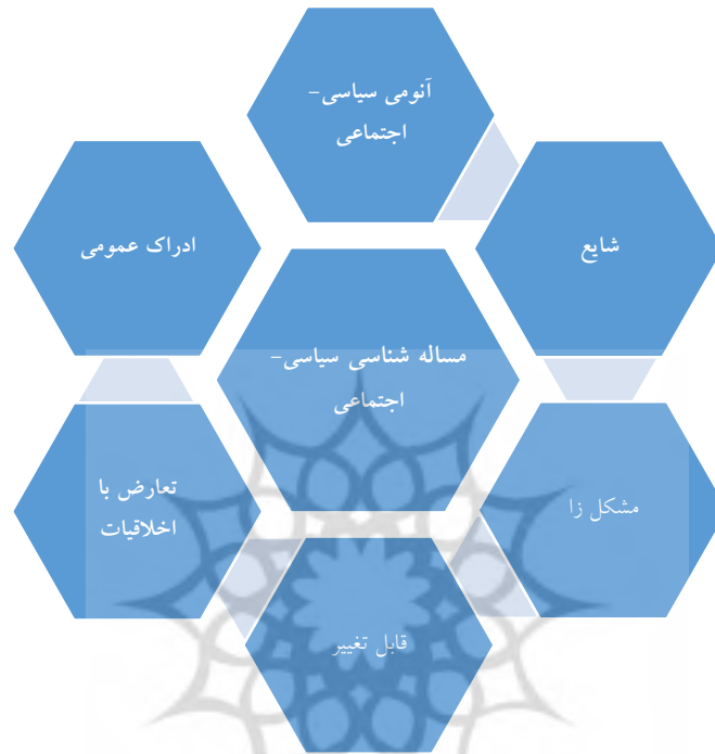
مدل مفهومی مساله شناسی سیاسی

از مجموع مطالب مذکور در مورد آنومی اجتماعی-سیاسی و نگرش ادراکی به مسایل اجتماعی و سیاسی می توان مدل زیر را ترسیم کرد: