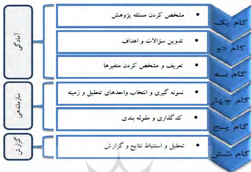
شکل ۱. مراحل تحلیل محتوای کیفی

در ادامه نیز برای روشن شدن موضوع مورد بحث و بیان نظرات تیم پژوهشگر درباره این موضوع و تدقیق اهداف تحقیق که از روش مصاحبه‌ی عمیق استفاده شده بود؛ در مرحله اول که با توجه به اهداف پژوهش ۲۰ نفر از مدیران و کارشناسان در حوزه شهرسازی که در زمینه مؤلفه‌های شهرسازی می‌توانستند کمک کنند به‌عنوان نمونه پرسشگری انتخاب شدند و بعد از صحبت با تیم پژوهشگر از بین ۲۰ نفر، ۱۵ نفر به‌عنوان نمونه نهایی انتخاب شدند. در انجام مصاحبه‌ها، پیش از هر مصاحبه فرم پروتکل مصاحبه به‌صورت حضوری یا از طریق رایانامه در اختیار مصاحبه‌شونده قرار می‌گرفت و جهت انجام مصاحبه زمانی تعیین می‌شد. در مصاحبه هم پس از معرفی خود و بیان مجدد عنوان، هدف انجام پژوهش، شرح مختصری درباره‌ی سؤالات اصلی و فرعی پژوهش داده می‌شد تا این ابهامات مصاحبه‌شونده برطرف شود و با توجه به جنبه‌ی جدید بودن موضوع پژوهش، از درک مناسب مصاحبه‌شونده از موضوع مورد تحقیق اطمینان حاصل شود؛ و بعد از انجام مصاحبه‌ها که به‌صورت ترکیبی حضوری و تماس تصویری (با توجه به شرایط کرونا) انجام گرفت؛ ۱۲ مصاحبه کامل و عمیق انجام شد. اغلب سؤالات اضافی به دنبال سؤالات شاخص مطرح می‌شد تا مصاحبه‌شوندگان توضیحات جزئی‌تری را بیان کنند. طول مصاحبه‌ها بین ۶۰ تا ۷۵ دقیقه متغیر بود. در پایان نیز از مصاحبه‌شوندگان درخواست می‌شد که اگر نظری در