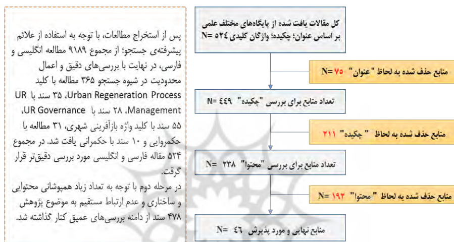
شکل ۲. نمودار چارت روند نمای پژوهش

غربال‌سازی در این مرحله بر اساس معیارهای ورود و خروج، مطابق نمودار شکل ۲ انجام شده است. در آخرین مرحله متن کامل اسناد از نظر ساختار، محتوا و روش‌شناسی بررسی شد و پس از حذف اسناد بی‌کیفیت و کمتر مرتبط، تعداد ۴۶ سند در سبد تحلیل پژوهش باقی ماندند.