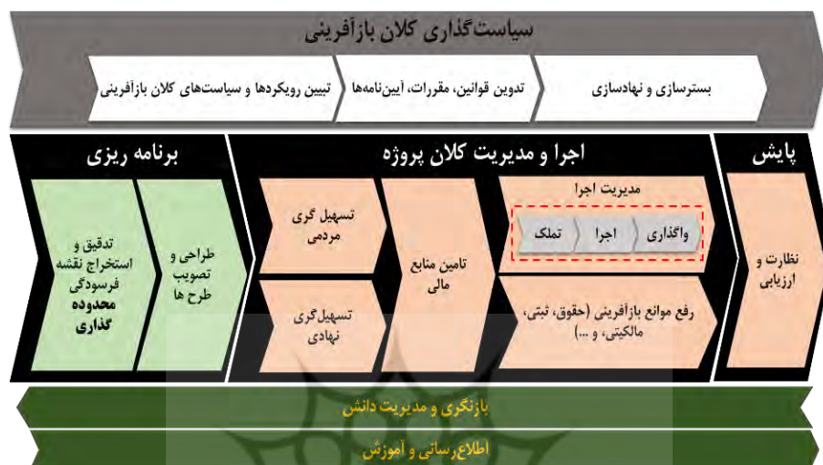
شکل ۴. چارچوب و الگوی پیشنهادی مدیریت بازآفرینی بافت‌های فرسوده شهری

۱۶۰ فصلنامه برنامه‌ریزی توسعه شهری و منطقه‌ای (علمی)، سال پنجم، شماره ۱۳، تابستان ۱۳۹۹ مدل ۸ پی ۱ در حکمرانی شهری، الگوی ساختار فرآیندی مدیریت بازآفرینی بافت‌های فرسوده شهری طرح‌ریزی شد که در شکل ۳ نشان داده شده است.