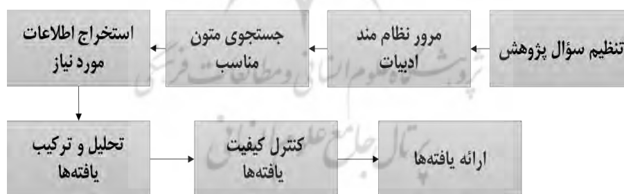
شکل ۱. روش فراترکیب Sandelowski & Barroso. 2006

(Flick.2006). همچنین، به لحاظ شیوه گردآوری داده‌ها، از نوع پژوهش‌های کیفی و بهره‌مندی از منابع اطلاعاتی کتابخانه‌ای است که با رویکرد مرور نظام‌مند ادبیات مرتبط با مدیریت بازآفرینی بافت‌های فرسوده شهری انجام شده است. هدف از مرور نظام‌مند ادبیات، دستیابی و تلفیق شواهد موجود به‌منظور پاسخ دادن به پرسش‌های آغازین پژوهش است که قادر است ابهامات موجود در یک زمینه خاص را با گردآوری شواهد کافی مرتفع نماید. زمانی که شواهد کافی برای یک زمینه خاص وجود نداشته باشد، تکنیک مرور نظام‌مند ادبیات می‌تواند با تجمیع و تلفیق یافته‌های مطالعات پیشین، دیدگاه‌های جدیدی برای توسعه نظریه‌ها ایجاد کند (Strech & Sofaer. 2012:123). از آنجاکه در ادوار مختلف با رویکردهای متفاوتی به پدیده نوسازی و بهسازی بافت‌های فرسوده شهری نگاه شده است، در این پژوهش با بررسی این رویکردها، اجزای کلیدی در فرآیند بازآفرینی استخراج‌شده تا به یک نظام جامع دست یافته شود. بر این اساس بررسی نظام‌مند مطالعات پیشین اهمیت بسیاری دارند؛ از این رو برای بررسی نظام‌مند ادبیات گذشته، از روش فراترکیب که یکی از روش‌های کیفی فرامطالعه‌ای ۱ است، استفاده شد (Bench & Day. 2010:489). هدف روش فراترکیب، استخراج نگاهی فراگیر نسبت به یک حوزه دانشی خاص با تحلیل زمینه‌های اصلی و فرعی است (Zimmer. 2006:313). بر این اساس در پژوهش حاضر از مراحل پیشنهادشده توسط ساندلوسکی (Sandelowski & Barroso. 2006) مطابق شکل ۲ استفاده شده است.