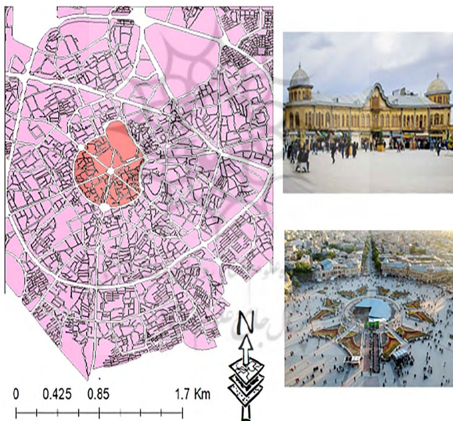
شکل ۲- موقعیت پیاده‌راه در شهر همدان

ساعت شبانه روز از دید شهروندان دارای کمترین احساس امنیت نسبت به خیابان‌های شش‌گانه شهر همدان بوده است و در مقابل خیابان بوعلی بیشترین حضورپذیری و سرزندگی را در بین خیابان‌های یادشده داشته است، در همین جهت، بررسی سوابق این محور تاریخی- فرهنگی پژوهشگران را بر آن داشت که با تبدیل شدن این محور تاریخی- فرهنگی به پیاده‌راه با دوره قبل از پیاده‌راه‌سازی، مشخص کنند که تأثیر بسزایی بر احساس امنیت شهروندان و گردشگران داشته و یا این‌که، هیچ تغییری از نظر احساس امنیت شهروندان با قبل از تبدیل نداشته است.