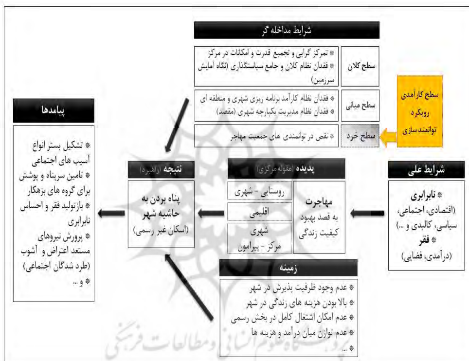
نمودار ۳- مدل علی زمینه‌ها، شرایط مداخله گر و پیامدهای توسعه سکونتگاه‌های غیررسمی در کشور

در نهایت این مقوله به‌عنوان پدیده و مقوله مرکزی انتخاب و بر مبنای آن نسبت به تدوین مدل علی تبیین‌کننده (نمودار شماره ۳) اقدام شد. در این مدل، پناه بردن به حاشیه شهر و شکل‌گیری سکونتگاه‌های غیررسمی به‌عنوان راهبرد اتخاذشده از سوی طبقات فرودست جامعه معرفی شده است.