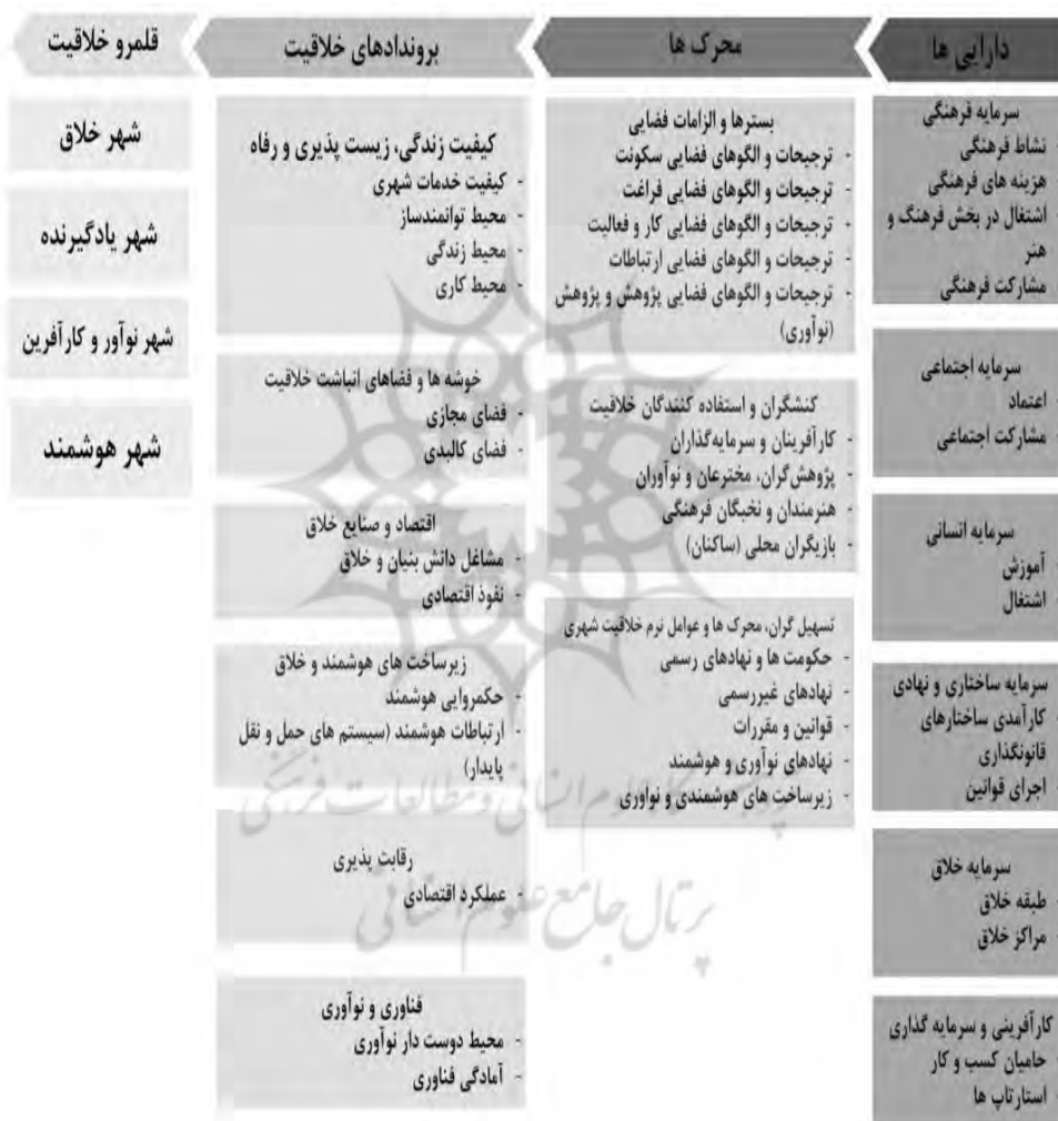
شکل ۲- چارچوب مفهومی پژوهش؛ مأخذ: نگارندگان

مفاهیم و مؤلفه‌هایی هستند که با توجه به مرور مبانی نظری و رتبه‌بندی‌های جهانی و تهیه شاخص تلفیقی، در سه بخش دارایی‌ها و محرک‌های خلاقیت و دستاوردها و برون‌دادهای خلاقیت و در چهار دامنه (قلمرو) نظری پشتیبان که دارای نقش کلیدی هستند (شهر خلاق، شهر هوشمند، شهر یادگیرنده و شهر نوآور و کارآفرین) بررسی شده‌اند.