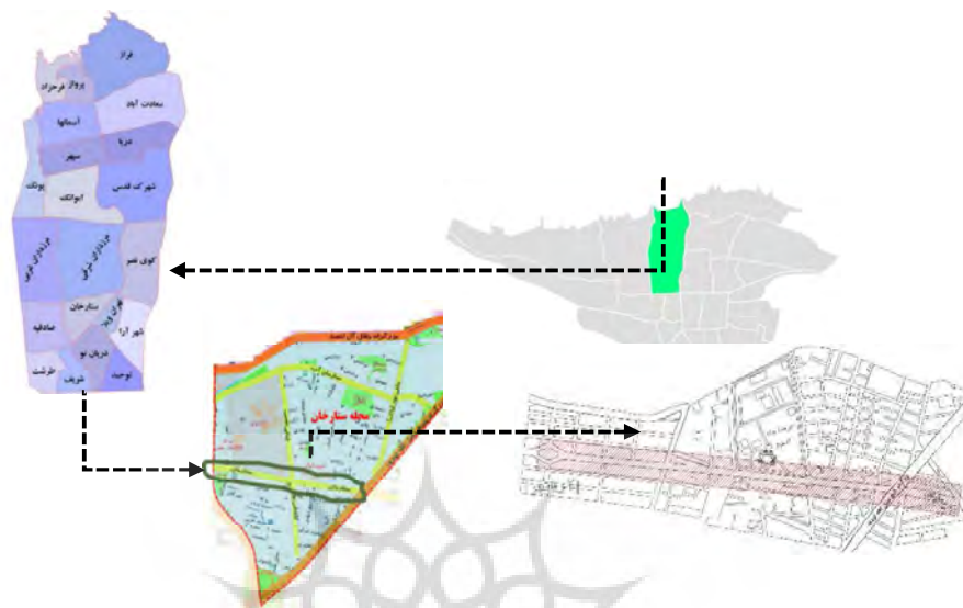
شکل ۲- معرفی حوزه مطالعاتی

ماتریس اصول و شاخصه‌ها: همان‌گونه که در چارچوب نظری پژوهش هم اشاره شد تحلیل‌ها نشان می‌دهند که ۱۳ اصل مهم مورد شناسایی در طراحی کالبد شهری (جدول شماره ۱) می‌توانند در شاخص‌های مختلف فضاهای شبانه شهری در چهار بُعد اقتصادی، اجتماعی، گردشگری و فرهنگی اثرگذار باشد. بر این اساس، با استفاده از اصول و همچنین عوامل چهارگانه و شاخصه‌های مؤثر بر فضای شهری ۲۴ ساعته، ماتریسی تهیه شده (جدول شماره ۵) که در آن، هرکدام از اصول یکی از حروف انگلیسی کوچک و هرکدام از شاخصه‌ها، یکی از حروف بزرگ انگلیسی را به خود اختصاص داده‌اند. با استفاده از روش دلفی، این ماتریس توسط ۱۰ کارشناس خبره حوزه تخصصی مورد تحلیل قرار گرفته است. هر کارشناس با مقایسه دوبه‌دوی هر اصل با هر شاخصه، به تناسب معنادار بودن و میزان تأثیرگذاری، اعداد ۱ تا ۵ را در ماتریس وارد نموده که میانگین نتایج آن در جدول شماره ۵ بیان شده است.