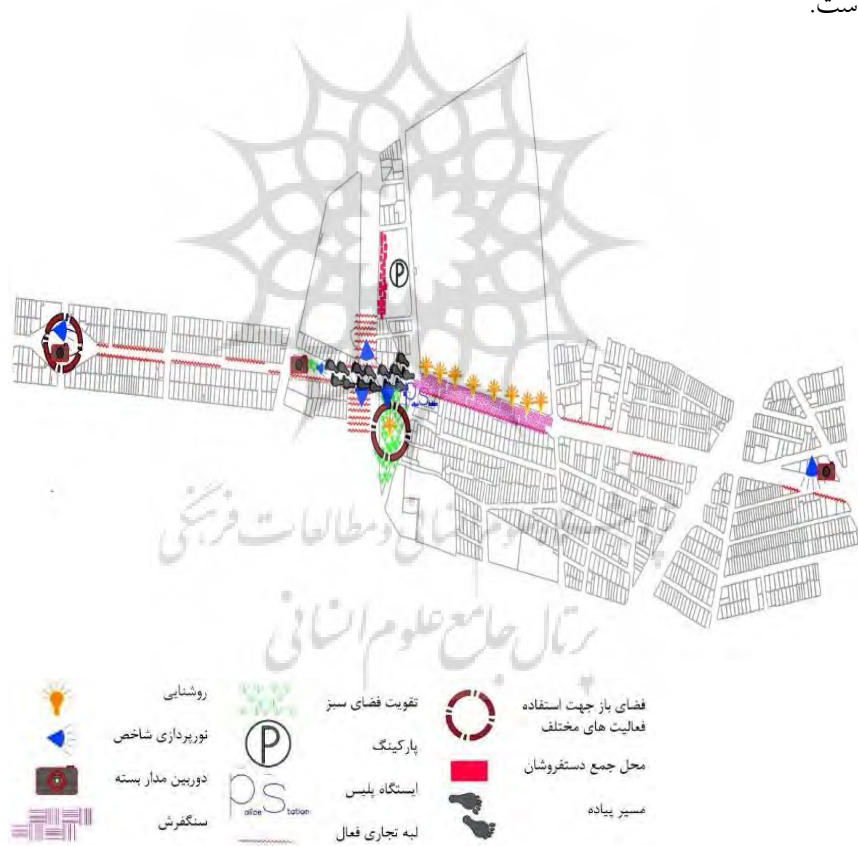
شکل ۳- اقدامات پیشنهادی در محدوده مطالعاتی در راستای تقویت زندگی شبانه

با توجه به مطالب یادشده اقدامات پیشنهادی در محدوده مطالعاتی در راستای تقویت زندگی شبانه بصورت نقشه فضایی و به‌طور خلاصه در شکل شماره ۳ نشان داده شده است.