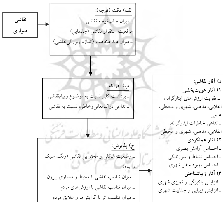
شکل ۲- ابعاد و مؤلفه های مدل نظری پژوهش

بر اساس چارچوب نظری هاولند درباره شکل گیری نگرش و نیز سؤالات پژوهشی، مدل نظری با توجه به مفاهیم اساسی و نیز معرف های تجربی در ادامه نشان داده شده است: