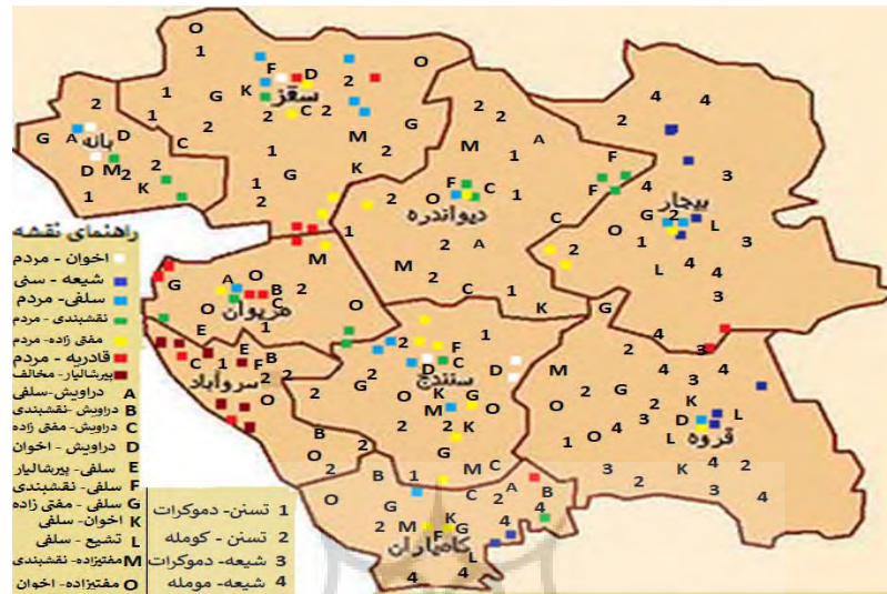
شکل ۲. پراکنندگی تضادهای دینی در کردستان (با راهنمای نقشه)

فرقه‌های اهل تسنن در بعضی از موارد با یکدیگر در تضاد هستند و در کردستان این تضادها در سطح فردی و گروهی و در قالب تهدید، توهین، تحقیر و دعوای فیزیکی مشاهده شده است. علاوه بر آن، این فرقه‌ها با مردم و افرادی که به آنان وابستگی و دلبستگی فکری و روحی ندارند نیز در تضاد قرار دارند و تساهل دینی را در حق آنان روا نمی‌دارند. همچنین رد پای بسیاری از تضادهای اجتماعی این فرقه‌ها با اهل تشیع در شهرهای قروه، بیجار و کامیاران یافت شده و نیز می‌توان بیان کرد که این فرقه‌ها با احزاب و مردم سکولار در کردستان نیز در تضاد قرار گرفته‌اند. بنابراین، این فرقه‌ها در کردستان با رویکردهای متنوع گرایش‌های دینی و غیردینی، موجب تضادهای اجتماعی زیادی شده‌اند. این تضادها در داخل فضای شهری بیشتر است و هرچه به مناطق مرزی نزدیک‌تر شویم، این تضادها کم‌تر و ملایم‌تر است.