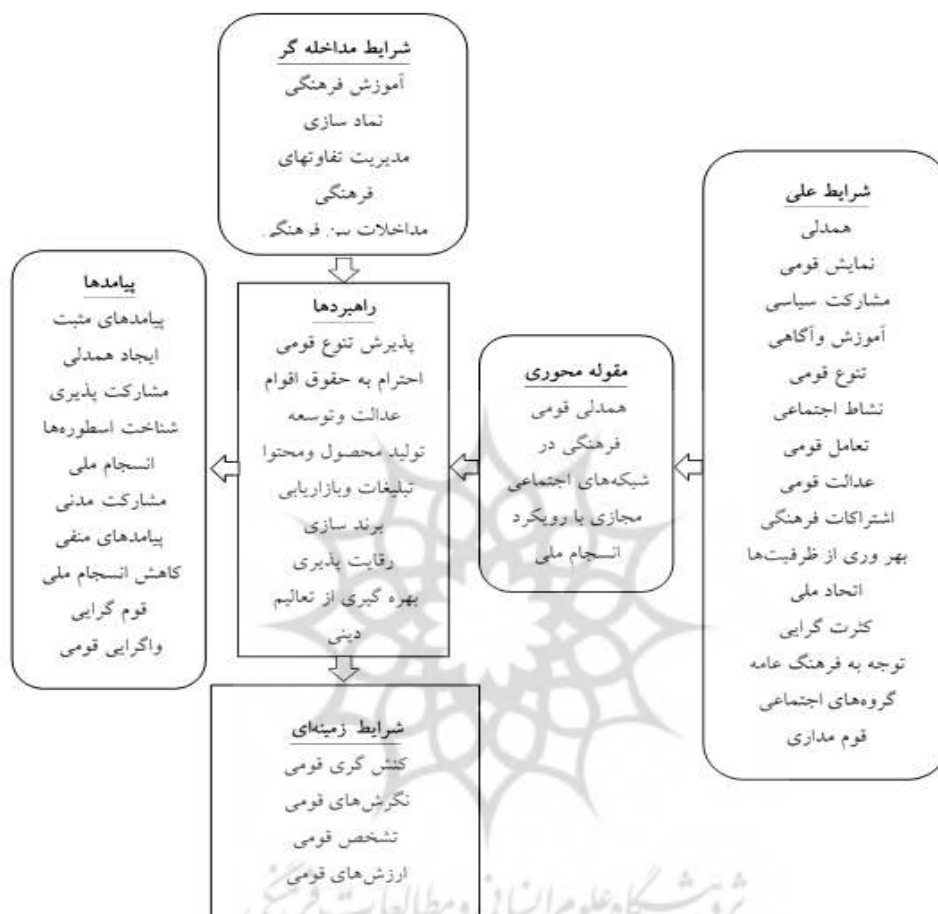
شکل ۳- مدل پارادایمی کدگذاری: فرایند همدلی قومی-فرهنگی در شبکه‌های اجتماعی مجازی با رویکرد انسجام ملی

در شکل ۲، مدل همدلی قومی-فرهنگی در شبکه‌های اجتماعی مجازی با رویکرد انسجام ملی نشان داده شده است. در شکل ۳، مدل پارادایمی کدگذاری: فرایند همدلی قومی-فرهنگی در شبکه‌های اجتماعی مجازی با رویکرد انسجام ملی نمایش داده شده است. در شکل ۴، مدل پارادایمی کدگذاری: فرایند همدلی قومی-فرهنگی در شبکه‌های اجتماعی