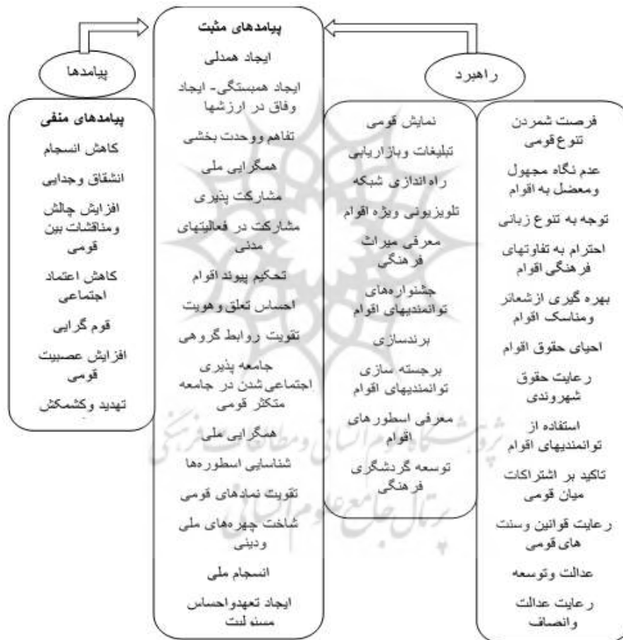
شکل ۴- مدل همدلی قومی-فرهنگی در شبکه‌های اجتماعی مجازی با رویکرد انسجام ملی

مجازی با رویکرد انسجام ملی نمایش داده شده است. همان‌طور که مشاهده می‌شود، شرایط علی به ایجاد مقوله‌های محوری منجر شده است. شرایط مداخله‌گر و مقوله‌های محوری سبب ایجاد راهبردها شده و در نهایت از راهبردهای شکل گرفته شرایط زمینه‌ای و پیامدها استخراج شده است.