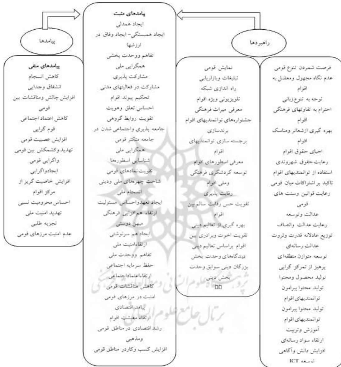
شکل ۲- مدل همدلی قومی-فرهنگی در شبکه‌های اجتماعی مجازی با رویکرد انسجام ملی