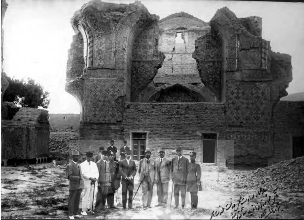
شکل ۱۳. علی منصور (استاندار آذربایجان، نفر دوم از سمت راست)، محمود جم (وزیر فوائد عامه، نفر سوم از سمت راست) و محمدعلی فروغی (نخست وزیر، نفر چهارم از سمت راست) در حین بازدید از خرابه‌های مسجد کبود تبریز در سال ۱۳۹۸ ه. ش.