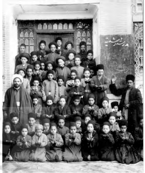
شکل ۷. دانش آموزان مدرسه رشیدیه در ژست دعا خواندن و علامت یادگیری نماز.