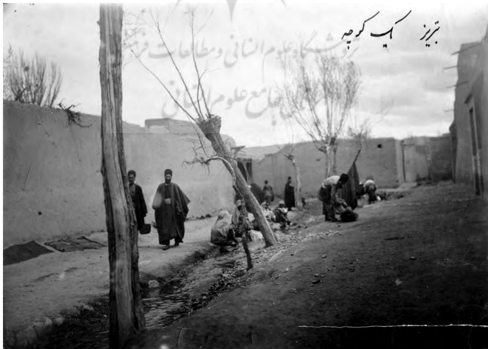
شکل ۱۴. نمایی از کوچه ای در تبریز.