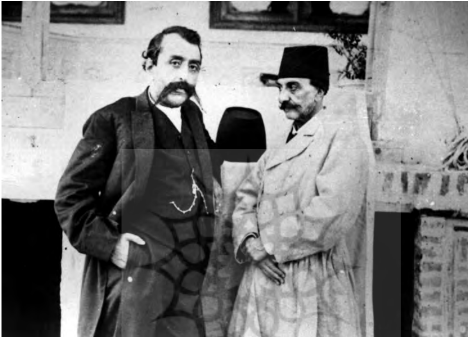
شکل ۳. مظفرالدین میرزا با لباس اروپایی و بدون کلاه در برابر دوربین.