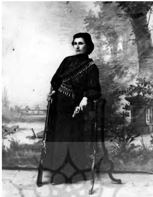
شکل ۹. زنی با لباس مجاهدان در آتلیه عکاسی.