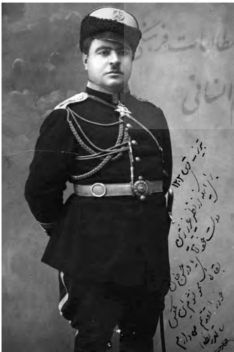
شکل ۴. سالارنظام از فرماندهان تبریز.