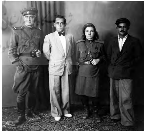
شکل ۵. چهار تن از اعضای فرقه دموکرات، حضور زنی نظامی و مردی با لباس نوین و آراسته، به بهانه القای وضعیت متعالی اعضا است.