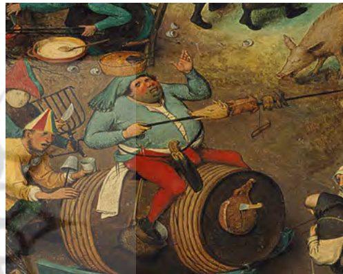
شکل ۱۵. پادشاه کارناوال که بر روی بشکه نشسته است، جزئی از تصویر اصلی.