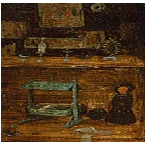
شکل ۹. محراب ساخته شده توسط کودکان و کشیش عروسی، جزئی از تصویر اصلی.