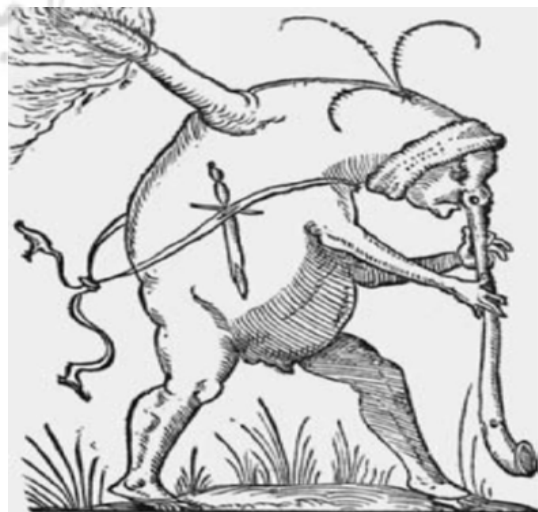
شکل ۳. رویاهای خنده‌دار، پانتاگروئل، ناشر ریچارد برتون، ۱۵۶۵ میلادی، پاریس.

البته باید این نکته را ذکر کرد که بسیاری از ناشران آن دوره در هلند و فرانسه و آنتورپ تصمیم گرفتند در کنار این مضامین طنز از تصاویری برای ارائه هر چه بهتر این مطالب استفاده کنند و از این طریق، مخاطب را بیشتر به خواندن این کتاب‌ها تشویق نمایند. نخستین گام‌ها برای چاپ این تصاویر که متناسب با خواست بازار بود را می‌توان در کتاب‌های ناشر فرانسوی «ریچارد برتون» ۳۵ مشاهده نمود. در آثاری که این ناشر و همکارش «فرانسوا دسپره» ۳۶ چاپ می‌کردند، تصاویری با مضامین طنز و بدن‌های عجیب و با حالات خنده‌آور و یا صحنه‌هایی از فعالیت روزمره مردم به چشم می‌خورد. این امر باعث شد بسیاری از نقاشان منطقه هلند و فلاندر نیز به خلق این‌گونه آثار توجه نشان دهند و موضوعات تمسخرآمیز، بیشتر در آثار آنها راه یابد (Ibid, 31-32).