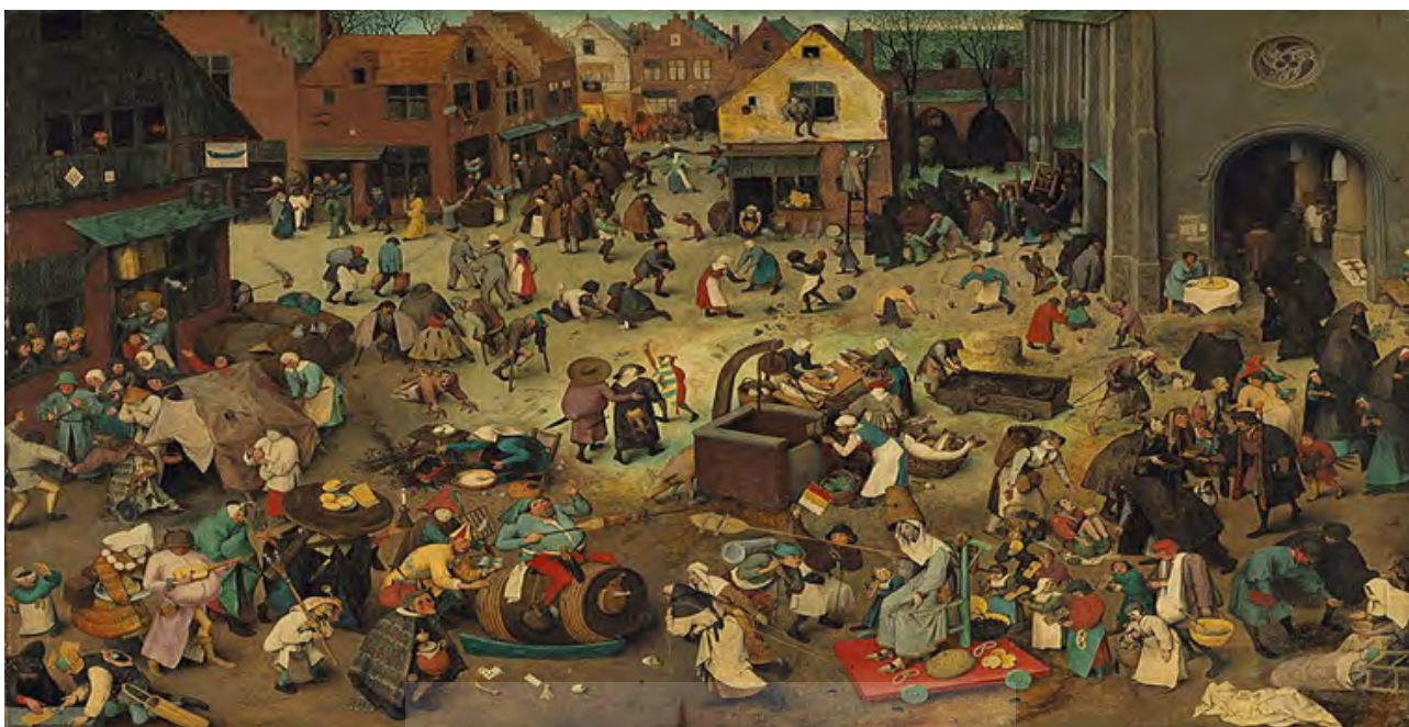
شکل ۱۳. پیتر بروگل مهنتر، جنگ بین کارناوال و روزه‌داران، ۱۵۵۹ میلادی، موزه تاریخ هنر وین.

عجیبی دچار نقص و عیب و زشت ترسیم شده‌اند، افرادی را در تصویر می‌بینیم که با نقص جسمانی در حال گدایی هستند و اغلب، لباس‌هایی به تن دارند که نقص جسمانی آنها را بی‌پرده نشان می‌دهد. گویی افراد، در مراسم کارناوال، ترسی از نمایش مشکلات جسمانی و نقص‌های خود ندارند و حتی علاقه دارند لباس‌ها و نقاب‌هایی که استفاده می‌کنند آن را زشت‌تر و مضحک‌تر نشان دهند. گویی بروگل سعی بر آن داشته تا پرداختن به حماقت و تمسخر در زندگی انسان‌ها را همراه با پای کوبی و سرمستی و پذیرش این مفاهیم را در زندگی روزمره به صورت ماهرانه به نمایش درآورد. مردی که بر روی بشکه نشسته است، از نظر چهره و اندام و لباس، وضعیت مضحکی دارد؛ او چیزی شبیه پای گوشت بر سر گذاشته و سیخی را در دست دارد که از اقسام گوشت‌های ممنوعه در ایام روزه پر شده است و او نماد کارناوالی است که در پشت سر وی در حال برگزاری است. در واقع، او نشانه حماقت و طنز موجود در کارناوال است که شبیه آن را در «تمثیل شکم‌پرستی و شهوت» ۴۵ بوش می‌توان ملاحظه کرد (شکل ۱۴). این فرد می‌تواند با آن اندام فربه‌ی که دارد و خوکی که درست در کنار او در حال خوردن کثیفی است، نماد همان شکم‌پرستی و شهوت نیز باشد (شکل ۱۵). می‌توان گفت بروگل سعی کرده است با استفاده از بیان طنزآمیز، مضمون اخلاقی مدنظر خویش را نیز برای مخاطبان اثر ترسیم نماید.