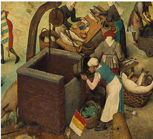
شکل ۱۷. زنانی که در میانه تصویر در حال ماهی پاک کردن هستند، جزئی از تصویر اصلی.