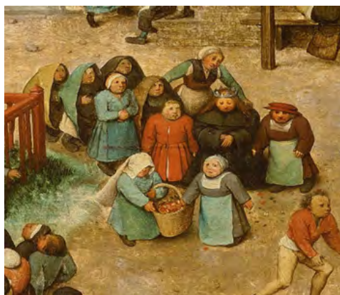
شکل ۷. دسته عروسی و عروس دهقان در میان آن‌ها، جزئی از تصویر اصلی.