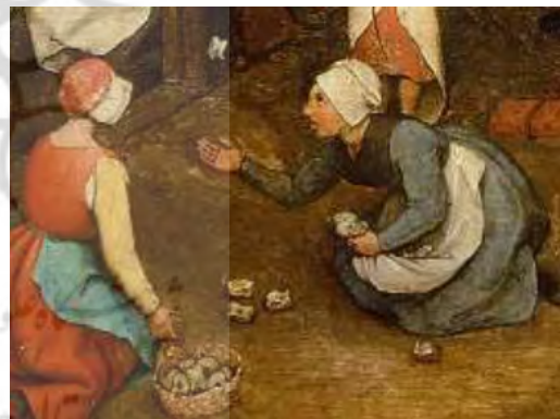
شکل ۱۰. دو دختر مشغول طاس بازی، جزئی از تصویر اصلی.

در سمت چپ تصویر، پسری را می‌بینیم که سر از دریچه بیرون آورده و در حال پرتاب چیزی به جغدی است که در لانه خود نشسته است. درواقع، بروگل به زیبایی این مسئله را ترسیم می‌کند که عقل و دانایی که جغد نماد آن است، مورد حمله حماقت کودکانه قرار می‌گیرد و در انبوهی از رفتارهایی که بر مبنای حماقت و طنز شکل گرفته، او نیز دستخوش تمسخر است و باید کنار رود زیرا در عرصه‌ای که حماقت و طنز مورد توجه قرار گرفته و منجر به سرمستی انسان شده،