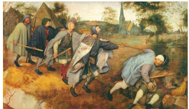
شکل ۴. پیتر بروگل مهتر، کوری عصاکش کور دیگر، ۱۵۶۸ میلادی، موزه ملی ناپل.

با توجه با آثار مختلف بروگل، نمی‌توان او را از پرداختن به موضوعات طنز و تمسخرآمیز در نقاشی‌هایش غافل دانست، او با استفاده از ابزار طنز و شوخی که موضوع مهم و پرمخاطب آن روزها بود، صحنه‌های مختلفی هم‌چون «الاغ در مدرسه» ۳۸ ، ضرب‌المثل‌های هلندی ۳۹ ، بازی کودکان ۴۰ و جنگ بین کارناوال و روزه‌داران ۴۱ را ترسیم نمود. در واقع، همان‌طور که اشاره شد طنز و خنده و حماقت بشری در ترسیم بسیاری از موقعیت‌های مختلف زندگی مردم سهم عمده‌ای یافته بود و آثار بروگل که به زندگی روزمره توجه داشت از این مطلب مستثنی نبود. او در نقاشی «الاغ در مدرسه»، یک ضرب‌المثل هلندی را ترسیم نموده‌است که اگر الاغ را نیز به مدرسه بفرستید چیزی نخواهد آموخت و این الاغ، استعاره‌ای از بچه‌های موجود در صحنه است (شکل ۵). آمیختگی حماقت با بشر و پرداختن به تمسخر و بازی که او را از ساحت فکر و آموختن به دور ساخته به‌شکلی که حتی الاغی را در تصویر شاهد هستیم که مشغول خواندن است و کودکان در حال تنبیه‌شدن و بازی و حماقت کودکانه خود هستند. طرح این‌گونه مسائل، آن هم با بیان طنزآمیز در آن روزها مورد توجه مخاطبان بود و در کتاب‌ها توسط ناشران به چاپ می‌رسید.