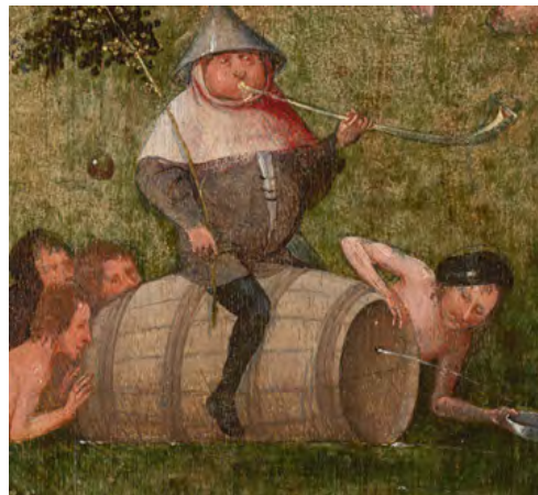
شکل ۱۴. هیرنیموس بوش، مرد بر روی بشکه در اثر شکم‌پرستی و شهوت، ۱۵۰۰ میلادی، گالری هنر دانشگاه ییل.

جالب است که افرادی نیز در میانه تصویر، مشغول فعالیت‌های زندگی روزمره خویش هستند و به هیچ‌کدام از فعالیت‌ها و وقایع دو طرف نقاشی توجهی ندارند و کار خود را انجام می‌دهند. مثلاً زنانی که در کنار چاه، مشغول ماهی پاک کردن هستند (شکل ۱۷) و یا زنی که مشغول نان‌پختن است. البته این زنان در میانه تصویر، در واقع، میانه‌گرایی و تعادل را در نگاه بروگل نشان می‌دهند. او زنانی را ترسیم می‌کند که در گروه افرادی هستند که نه به بخش حماقت و تمسخر این نمایش تعلق دارند و نه به بخش مذهبی و اخلاق‌مدار این جریان توجه می‌کنند و با آن‌که در صحنه حضور دارند و تعدادشان بسیار کم است، دسته و گروه سومی را در نقاشی به وجود آورده‌اند که به درستی در مرکز تصویر و در میانه دو گروه ترسیم شده‌است. بروگل همه طیف‌های موجود در جامعه را مدنظر قرار داده و نقش هیچ‌یک از این افراد را در اثر خود فراموش نکرده است.