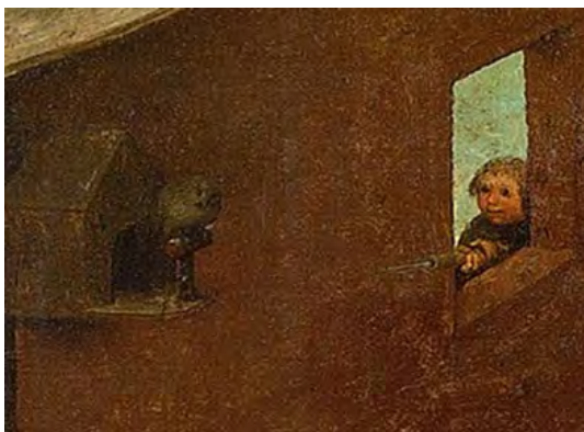
شکل ۱۲. پسری که قصد پرتاب چیزی را به جغد در لانه دارد، جزئی از تصویر اصلی.