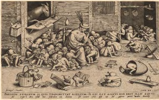
شکل ۵. پیتر بروگل مهتر، الاغ در مدرسه، ۱۵۵۷ میلادی، گالری ملی هنر واشنگتن دی. سی.