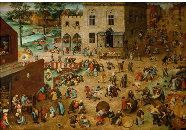
شکل ۶. پیتر بروگل مهتر، بازی کودکان، ۱۵۶۰ میلادی، موزه تاریخ هنر وین.

نمونه‌ای از این تقلید را در میانه تصویر، در مراسم عروسی شاهد هستیم؛ عروس با همان شمایل عروس‌های روستایی که دسته‌ای از کودکان در حال همراهی وی هستند و دخترکانی که جلوتر از آنها با سبدهای گل در حال گلریزی هستند تا وی را به کلیسای ساختگی برسانند (شکل ۷). در سمت چپ، در قسمت پایین تصویر، صفی را برای غسل تعمید می‌بینیم که شخصی جلوی صف بر روی سر خود پارچه‌ای انداخته که تقلیدی از شخصیت‌های مذهبی است و گویی نوزادی را در آغوش دارد و برای انجام غسل تعمید به کلیسا می‌برد (شکل ۸). این مراسم را می‌توان در ادامه مراسم عروسی دانست که