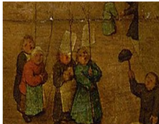
شکل ۱۱. صف راهپیمایی کودکان در پیروی از رهبر خود، جزئی از تصویر اصلی.