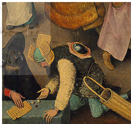
شکل ۱۶. دو مرد در حال طاس‌بازی، جزئی از تصویر اصلی.

حال ایفای نقش خود هستند. این قسمت از تصویر نیز اشاره به مسئله نمایش و بازی در نقاشی بروگل دارد. بروگل در سه اثر خود، «بازی کودکان»، «ضرب‌المثل‌های هلندی» و «جنگ بین کارناوال و روزه‌داران» به مسئله نمایش و بازی و حماقت در صحنه‌هایی شبیه به سن نمایش، پرداخته است. گویی وی