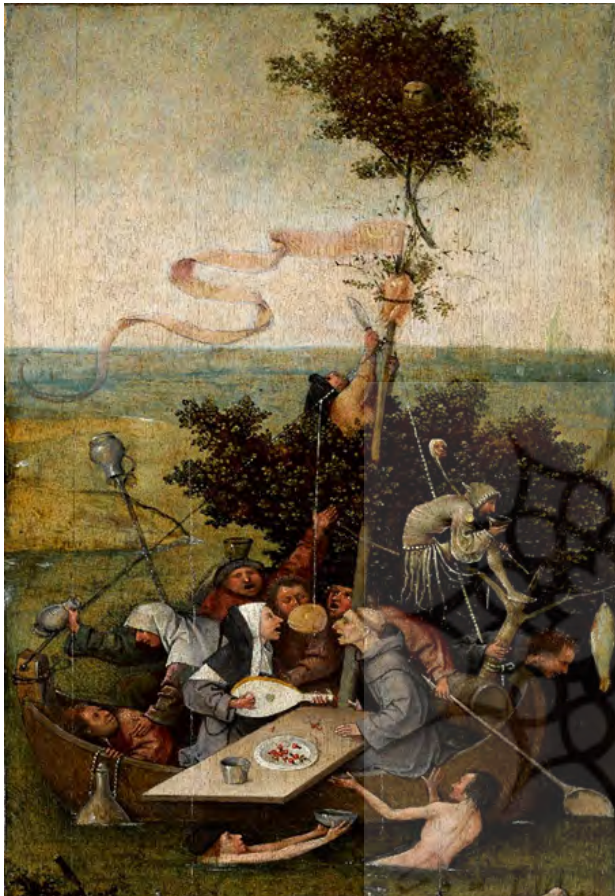
شکل ۱. هیرونیموس بوش، کشتی احمق‌ها، ۱۵۰۰ میلادی، موزه لوور پاریس.

مردان کور و گدایان داشت که بعدها ادامه این سبک وی در نقاشی پیتر بروگل مهتر به شیوه بازی مشاهده می‌شود به صورتی که بروگل را برخی «بوش ثانی» نیز می‌نامیدند (Van der Coelen, Lammertse & Richards, 2019, 13-14).