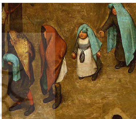
شکل ۸. صف غسل تعمید در بازی کودکان، جزئی از تصویر اصلی.

در این تصویر، می‌تواند شاهد خودی باشد که جریان زندگی و مسائل آن در حد یک بازی کودکانه و ساده تنزل پیدا کرده و با جنبه‌های طنز و کمیک آن مواجه شود. مخاطب آن روزهای اروپا برای آن که شجاعت ایستادگی در برابر خواست و عقاید کلیسا و جنگ‌های ویرانگر را داشته باشد، باید به مفاهیم خنده و حماقت روی می‌آورد تا قواعد زندگی را به بازی گیرد. در قسمتی از کتاب در ستایش حماقت اثر اراسموس، به مسئله حماقت و دیوانگی کودکان این‌گونه اشاره می‌شود: