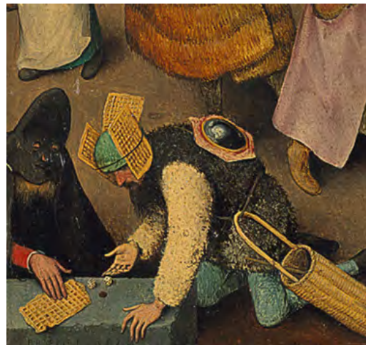
شکل ۱۶. دو مرد در حال طاس‌بازی، جزئی از تصویر اصلی.