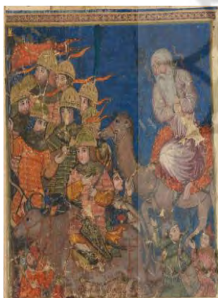
تصویر ۸. فریدون ضحاک را به دماوند می‌برد، برگی از شاهنامه ایلخانی