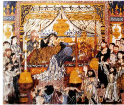
تصویر ۱۰. زاری بر جسد اسکندر، برگي از شاهنامه ایلخانی

در نگاره دیگری (تصویر ۱۰) با عنوان زاری بر نعش اسکندر، مفاهیم دیگری مستفاد می‌شود. بر اساس روایت شاهنامه، لحظه‌ای که اسکندر چشم از جهان می‌بندد، فریاد گوش‌خراشی از لشکر وی بلند می‌شود. همه سپاهیان اسکندر، خاک بر سر ریخته و خون دل از مژگان جاری می‌سازند. هزاران اسب را دم بریده، زین‌ها را نگونسار بر اسب نهاده و سرای نشست را آتش می‌زنند (حسین پور میزاب و دیگران، ۱۳۹۹: ۴۶). اسکندر که از او با نام نیک یاد شده است و در هنر ایران شخصیتی برگزیده و ممدوح دارد، در این نگاره که حالت حزن و اندوه دارد، متوفی شده و دو معلم او، افلاطون (در سمت چپ) و ارسطو (در سمت راست) بر جنازه او حاضر شده‌اند. یکی از ویژگی‌های این نگاره چهره‌های بلندقامت و سه‌رخ ریش‌دار است به انضمام لباس‌های پرچین که همگی متأثر از هنر بیزانس هستند و غیر از این نشانه‌هایی از هنر مسیحی در خود دارند؛ قندیل و شمعدان، گلدان و نقوشی که در هنر تصویری بیزانس نمود داشته است.