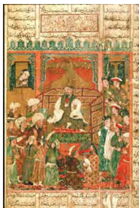
تصویر ۹. بر تخت‌نشستن ضحاک، شاهنامه ایلخانی