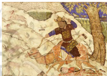
تصویر ۷. نگاره بهرام گور و آزاده، (بختیاری‌فرد، ۱۳۹۵: ۱۹۵)

هم‌چنین داستان دیگری درباره بهرام در شاهنامه و دیگر متون وجود دارد و آن مجلس شکاری است که بهرام به همراه آزاده، ندیمه خود برگزار می‌کند (تصویر ۷).