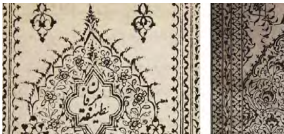
تصویر ۱. دیدار ابوبکر و حضرت محمد، نسخه مصور جامع‌التواریخ

در نگاره‌های جامع‌التواریخ یا کتاب جامع تاریخ جهان، نگاره‌های مختلفی با نمود دینی و از مذاهب مختلف (با توجه به محتوای کتاب) ارائه شده است. در شاهنامه دموت، مفاهیم مستقیمی از مذاهب متکثر آن زمان ارائه نشده؛ اما اشاره به دین‌ورزی در خصوص شاهان، حاکمان و افراد مختلف، صورت گرفته است و بعدی نمود تصویری آن است. اگرچه نمود مذهب را می‌توان از عناصر تصویری موجود در نگاره‌ها شناخت؛ اما لزوماً اشارات مستقیمی به محتوای دین و مذهب نشده است. همان‌طور که اشاره شد، هنرمندان مختلفی در تصویرگری این نسخه و همچنین نسخه جامع‌التواریخ (در ربع رشیدی) نقش داشته‌اند که متأثر از هنر پیش از اسلام، هنر مانوی و هنر بیزانس بوده‌اند و نشانه‌های هر یک از این تأثیرات را می‌توان در نگاره‌های جامع‌التواریخ دید (تصاویر ۱ تا ۴).