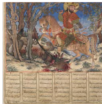
تصویر ۶. کشتن گرگ توسط بهرام گور، شاهنامه دموت

هم‌چنین داستان دیگری درباره بهرام در شاهنامه و دیگر متون وجود دارد و آن مجلس شکاری است که بهرام به همراه آزاده، ندیمه خود برگزار می‌کند (تصویر ۷).