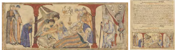
تصویر ۱: تولد حضرت محمد (ص) ، f.42r

ارتباط با واقعیت: ۱۴ شخصیت درون نگاره شاید اشاره‌ای به چهارده کنگره شکسته‌شده از ایوان مدائن، نامدارترین بنای معماری دوره ساسانی بوده که در شب ولادت پیامبر (ص) سقوط کرده است. درآمیختن و تعامل متن کلامی و تصویر با عبارت «ولادت همایون پادشاه کائنات علیه‌السلام» کارکرد بصری نگاره را قوی‌تر کرده است. افزون بر این، نوشتار روی نگاره نوعی مستندسازی دیداری را سبب می‌شود که تأیید واقعیت است. جامه‌ها، رختخواب، معماری، صندلی، پرده سرسرا و حتی نوع آویختن آن، نشانگر یک سرای و اندرونی دوره ایلخانی است؛ اما پارچه راه‌راهی که بر روی رختخواب در اینجا و یا بر زمینه پوشاک حضرت در برخی تصاویر دیده می‌شود، احتمالاً تحت تأثیر روایاتی که جامه آن حضرت را توصیف می‌کردند، ترسیم شده است. «چنین منسوجاتی در آن روزگار در یمن بافته می‌شد و از آنجا به اقصی نقاط شبه‌جزیره و حتی فراتر از آن، دادوستد می‌شد» (دُزی، ۱۳۸۹: ۸۸-۸۹).