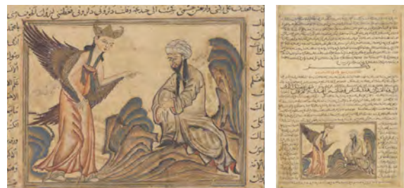
تصویر ۴: ابلاغ رسالت (f.45r)

ارتباط با واقعیت: نقاش همچون دیگر جزئیات، از منابع تاریخی برای مصورکردن اجزای صورت پیامبر اکرم (ص) استفاده کرده؛ به‌طوری‌که گفته شده است که «ابروی مبارک پیامبر (ص) مقدس بود ولی پیوسته نبود... چشم‌های مبارک آن حضرت به‌غایت سیاه بود و مژگان‌ها دراز» (کربلایی تبریزی، ۱۳۸۳، ج ۱: ۱۷۳).