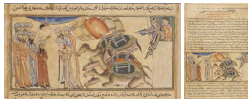
تصویر ۲: جوانی حضرت محمد (ص) در پیشگاه راهبان f.43v

چگونگی ترکیب‌بندی عناصر و پیکره‌ها: در این نگاره، فضا به‌طور نامحسوس به دو بخش تقسیم شده و فرم چندلایه مواج کوه در اطراف پیکر پیامبر (ص) به گونه‌ای است که گویی شمایل ایشان را کاملاً محصور کرده تا حضور آن حضرت را در دهانه غار، به نظاره‌گر بیشتر القا کند (صداقت و خورشیدی، ۱۳۸۸: ۹۴). کاربرد رنگ سرد کوه‌ها در تقابل با رنگ چهره و لباس فرشته، نشان‌دهنده "مژده رحمت سرور" است. آرایش هیئت پیامبر همانند آرایش سایر پیکره‌ها در نسخه جامع‌التواریخ است؛ همان گیس مبارک فروهشته را که در سایر نگاره‌ها دیده‌ایم، در این نگاره نیز باز می‌یابیم؛ اما دیگر اثری از چهره‌نگاری چینی دیده نمی‌شود. پیامبر (ص) درون غار، غرق تأمل است و زانوی غم بغل کرده که این مورد شاید اشاره به مشکلاتی است که در راه ابلاغ دستور الهی از سوی مشرکان فراروی ایشان نهاده می‌شد