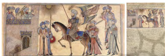
تصویر ۹: حضرت محمد (ص) در برابر قلعه بنی‌نضیر، F72a https://www.khalilicollections.org/islamic-arts/ Attrived: 05/04/2019

ارتباط با واقعیت: موهای سیاه و بلند پیامبر اسلام (ص) همچون نگاره‌های قبلی بر مبنای روایات تاریخی دیده می‌شود. همچنین عمارتی که اهالی بنی‌نضیر در آن ساکن هستند، با نقوشی از تزئینات معماری دوره ایلخانی آراسته شده است.