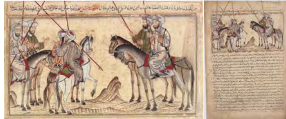
تصویر ۷: پیامبر (ص) حمزه و حضرت علی (ع) را رهسپار غزوه بدر می‌کند

ارتباط با واقعیت: موهای سیاه و بلند پیامبر اسلام (ص) همچون نگاره‌های قبلی بر مبنای روایات تاریخی دیده می‌شود.