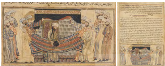
تصویر ۳: حل مناقشه حجرالاسود f.45r

ارتباط با واقعیت: نقاشی ساختمان کعبه شبیه به بنای آن در مکه بوده و حتی رنگ سیاه کسوه که در دوره عباسیان رنگ رسمی کعبه شد نیز نمایان است؛ جز آنکه یک ردیف حاشیه زین مزین به نقوش گیاهی سوزن‌دوزی‌شده، در صدر بنا، دیده می‌شود که احتمالاً برگرفته از نقوش تزئینی مندرج در آثار معماری معاصر ایلخانی است.