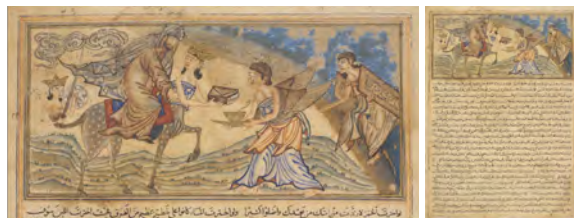
تصویر ۵: واقعه معراج و نزول قرآن کریم به حضرت محمد (ص)، f.55r https://images.is.ed.ac.uk/luna/servlet/view/search;JSESSIONID=62b77aef-3161-4e6a-9d40-79dee0f47dfb?q=work_title=%20Jami%20%27%20al-Tawarikh%20

ارتباط با واقعیت: در سمت چپ تصویر و درست پشت سر حضرت، توده‌ای ابر قرار دارد که یکی از نشانه‌های پروردگار است که در قرآن کریم به آن اشارات فراوانی شده است. ۴