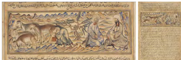
تصویر ۶: ابوبکر و حضرت محمد (ص)، f.57r

است. هرچند چین‌وشکن جامه‌ها نشان از تأثیرات بیزانس بوده؛ اما اسلوب نمایش پیکره‌های حیوانی با پردازش‌های ظریف و نوع ترکیب‌بندی و اتصالات عناصر تصویری به کادر، از ویژگی‌های نقاشی ایرانی است.