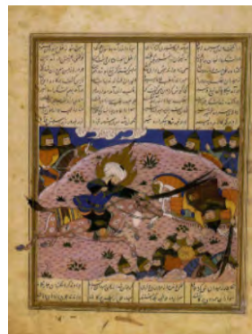
تصویر ۶: شکست خوردن اردشیر به دست حضرت علی (ع)، خاوران‌نامه (خوسفی بیرجندی، ۱۳۸۱: ۷۷)

در نگاره شماره ۶، با عنوان شکست خوردن اردشیر به دست حضرت علی، امام به همراه اسبش، از خارج تصویر به سمت داخل در حال حرکت است که بخش پویا و فعال کادر را تشکیل می‌دهد؛ اما دشمن که در سمت راست قرار دارد، در حال خارج شدن از کادر است (نشان‌دهنده بیرون کردن از صحنه نبرد توسط امام است). اردشیر ساکن و بدون حرکت به تصویر درآمده است که نشان‌دهنده شکست او در برابر حضرت علی است. یاران امام در بالای تصویر با صلابت و پر قدرت ایستاده‌اند و در پایین کادر سربازان دشمن هراسان و در حال فرار به تصویر درآمده‌اند (عبدی، ۱۳۹۱: ۹۰). پیراهن حضرت علی در این تصویر آبی است. رنگ آبی نماد پیروزی، آرامش و آزادی است و رنگ صورتی در پس‌زمینه (صخره) خونی است که برای ایجاد آرامش و آزادی ریخته شده است. همچنین گل‌هایی که بر روی صخره‌ها به تصویر کشیده شده‌اند، نماد جشن برای پیروزی است. در واقع، نقاش در این نگاره از رنگ در جایگاه نمادینش استفاده کرده است و با استفاده از عناصر بصری و کیفیات تجسمی توانسته است به‌خوبی این مبارزه را به تصویر بکشد (همان، ۹۸-۹۰).