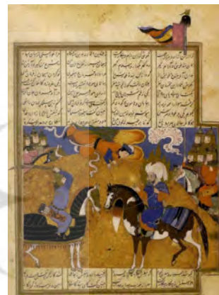
تصویر ۱: برآمدن جبرئیل به میدان نبرد، برگی از نسخه خاوران‌نامه (خوسفی بیرجندی، ۱۳۸۱: ۸۰)

یاری‌رساندن به پرهیزگاران است. در عقاید زرتشتیان فروهرها یا فرشتگان، نیروی دشمن را در میدان‌های جنگ بی‌اثر می‌کنند و کمک‌خواستن از آن‌ها نقش مهمی در پیروزی پیروان اهورامزدا داشته است و در قرآن این مفهوم به‌عنوان امداد غیبی در جهاد و پیروزی حق علیه باطل استفاده شده است (همان: ۴۶). نشان کلمه الله بر بالای بیرق سپاه اسلام، ارتباط آن‌ها را با عالم بالا نشان می‌دهد که در قسمت بالای تصویر قرار گرفته است. در این نگاره امام‌علی (ع) همانند دیگر نگاره‌ها با پوشش عادی و هاله‌ای نورانی که نشان‌دهنده ارتباط معنوی با مبدأ نورانیت است، سوار بر اسب با جزئیات زیبا تصویر شده است (شریعت و زینلی، ۱۳۸۸: ۵۴).