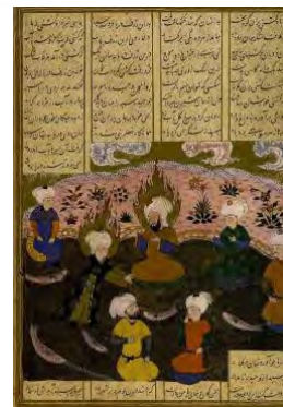
تصویر ۸: در آمدن حضرت خضر به یاری امیرالمؤمنان، خاوران‌نامه، (خوسفی بیرجندی، ۱۳۸۱: ۴۴۹)

نگاره ۸، در آمدن حضرت خضر (ع) به یاری امیرالمؤمنان نام دارد که امام‌علی را به همراه ابوالمحسن، مالک و تنی چند از یارانش، درحالی‌که در دریا بر روی سپرهایشان شناورند، نشان می‌دهد. حضرت خضر یکی از انبیای الهی است که با نوشیدن آب حیات، عمری جاودانه یافت. نگارگر، خضر نبی را با محاسن سفید و هاله نورانی دور سر، نشان داده و آن را نشانه‌ای برای دانایی و فرزنگی وی قرار داده است. او در حال کشیدن سپری است که حضرت امیر بر روی آن نشسته است. او با کشیدن سپرها به سمت خشکی، آن‌ها را نجات می‌دهد. به نظر می‌رسد این واقعه از جمله وقایع افسانه‌ای خاوران‌نامه باشد که از شاهنامه الهام گرفته و احتمالاً خضر نبی جایگزین شخصیتی در شاهنامه؛ یعنی همان سیمرغ نجات‌دهنده و گره‌گشای مشکلات زال و رستم، شده است (شریعت و زینلی، ۱۳۸۸: ۵۶).