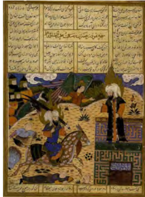
تصویر ۲: معجزه کردن حضرت رسول (ص)، برگی از نسخه خاوران‌نامه (خوسفی بیرجندی، ۱۳۸۱: ۸۲)

مثلی به تصویر کشیده است تا ارتباط معنوی و روحانی این سه را با هم نشان دهد (شریعت و زینلی، ۱۳۸۸: ۵۴).