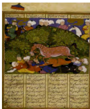
تصویر ۱۰: نبرد دلدل با سپاه خاوران، خاوران‌نامه (خوسفی بیرجندی، ۱۳۸۱: ۵۳)

از آن‌جا که ایرانی‌ها در دوره‌های مختلف به گذشته باستانی خود افتخار می‌کردند؛ مخصوصاً زمانی که مورد حمله بیگانگان قرار می‌گرفتند، بازگشت و توجه به گذشته باستانی و ملی در آن‌ها بیشتر می‌شد. در این دوره که ترکمانان به ایران تسلط داشتند، خود را از نسب چنگیز می‌دانستند و از این طریق خود را وارث سلطنت می‌دانستند؛ بنابراین در این دوره اشعار حماسی ایرانیان دوباره رونق گرفت که از جمله آن‌ها خاوران‌نامه ابن حسام خوسفی است.