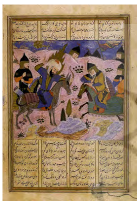
تصویر ۷: نبرد امیر با صلصال، خاوران‌نامه (خوسفی بیرجندی، ۱۳۸۱: ۱۳۶)

نگاره شماره ۷، نبرد حضرت علی و صلصال (پادشاه کافر سرزمین خاور) را نشان می‌دهد. در این مبارزه حضرت علی پس از مدتی مبارزه، با پرتاب تیر او را از پای در می‌آورد. تیر و کمان نمادی از دقت نظر و باریک‌بینی انسانی است که قصد دارد با هدف‌گیری و پرتاب مناسب تیرها دشمن را شکست دهد. تیر و کمان، هوش و درایت و ظریف‌بینی صاحب خود را نشان می‌دهد (خلج امیرحسینی، ۱۳۸۷: ۵۰). تیر و کمان حضرت علی در این نگاره، وسیله‌ای برای حمله کردن به بدی‌ها و پلیدی‌هاست. حضرت علی که در اینجا نماد پاکی است، با پرتاب تیر به سر صلصال؛ یعنی جایی که افکار پلید تولید می‌شوند، بر پلیدی‌ها چیره می‌شود (سیاهوش دستجردی، ۱۳۹۱: ۷۴).