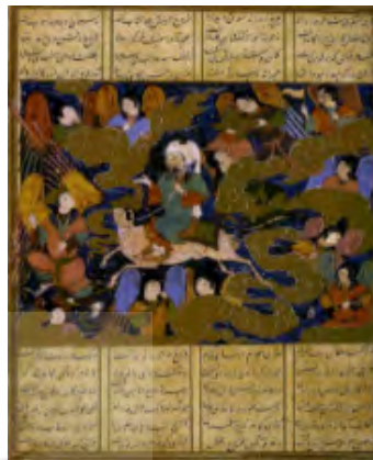
تصویر ۳: معراج حضرت رسول (ص)، برگگی از نسخه خاوران‌نامه (خوسفی بیرجندی، ۱۳۸۱: ۱۵۲)

و خداوند است. پیامبر اکرم (ص) در معراج با راهنمایی ملک اقرب (جبرئیل) از طبقات عرش عبور می‌کند و با صور مثالین (مینوی) یا همان فرشتگان محشور می‌شود و به عرش اعلی (روشنی بی‌پایان) می‌رسد که در واقع رجعتی به مبداء نورانی و وحیانی است، که همان پیوستن نفس نورانی حضرت به نور خداست و معراج، تمثیلی از این پیوستن است (شریعت و زینلی، ۱۳۸۸: ۵۴).