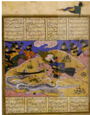
تصویر ۹: حضرت امیر در نبرد با اژدها، خاوران‌نامه (خوسفی بیرجندی، ۱۳۸۱: ۳۱)

در این نگاره حضرت علی با هاله‌ای نورانی، با ذوالفقار ضربه‌ای سخت به اژدها وارد می‌کند و یاران آن حضرت در حال نظاره صحنه هستند. فردی در سمت راست تصویر، پرچمی را به اهتزاز درآورده است که نشان از پیروزی حق علیه باطل است (شریعت و زینلی، ۱۳۸۸: ۴۱). در شاهنامه هم از پهلوانان زیادی مانند رستم و اسفندیار به‌عنوان پهلوان اژدهاکش یاد شده است. حضرت علی و پهلوانان شاهنامه، به‌عنوان مردانی ظاهر شده‌اند که در روزگار خود جهت گسترش آیین و شریعت الهی و حمایت از پیامبر خدا مبارزه و پلییدی را نابود کرده‌اند (کنبای، ۱۳۸۱: ۵۵).