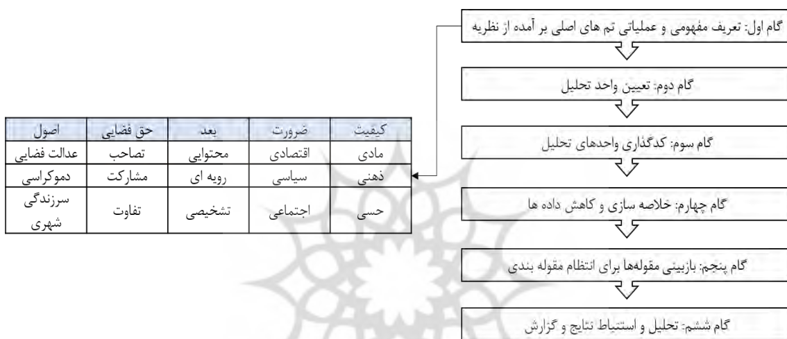
شکل ۲. فرایند تحلیل محتوای کیفی در تحقیق حاضر

مطابق با فرایند مرسوم در روش‌شناسی کیفی جهت‌دار، ماتریس توسعه شهری مبتنی بر حق به شهر به‌عنوان مفهوم اولیه جهت‌گذاری و شناسایی مقوله‌ها اساس کار قرار گرفته است. نظام کدگذاری پژوهش به ترتیب شامل مضمون، مقوله، زیر مقوله و رمز یا کد است که طی یک مسیر نظام‌مند، مقولات یا نقشه مفهومی را در یک رویکرد قیاسی ترسیم می‌کند. در فرایند انجام کار، مضمون‌ها (حق به تصاحب، مشارکت و تفاوت) از ادبیات نظری استخراج و وام گرفته شده و سپس کدها (رمز) ذیل هر مضمون تعریف شده است. لازم به ذکر است که کلمه، جمله و پاراگراف واحدهای تحلیل محتوای پژوهش حاضر را تشکیل می‌دهند که طی تحلیل آن، کدها به‌منظور استخراج مقوله‌ها (اصلی و سطح دو) استخراج شده است. پس‌ازانجام کدگذاری در گام خلاصه‌سازی و بازیابی مقوله‌ها، در یک فرایند رفت و برگشتی و اصطلاحاً غوطه‌ور شدن در داده‌ها، مقوله‌های اصلی استخراج شد و بر اساس پیوندی که بین ویژگی‌هایی هر مقوله‌ی اصلی وجود داشت و در ارتباط با موضوع تحقیق معنا پیدا می‌کرد، مقوله‌های سطح دو نیز تعریف شد. به‌طور کل مضامین دارای بالاترین سطح انتزاع و کد یا رمز، پایین‌ترین سطح انتزاع را در این ارتباط نشان می‌دهد.