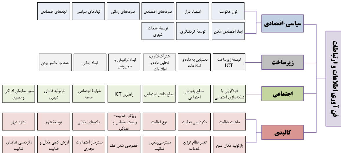
شکل ۲. مؤلفه‌های اصلی اثرگذار فناوری اطلاعات و ارتباطات به تفکیک ابعاد ۴گانه

با توجه به رویکردهای متفاوت در خصوص توسعه فناوری اطلاعات و ارتباطات، (رویکرد ضد شهری، جبرگرایی فناوری، آینده‌گرایی و آرمان‌شهرگرایی، ضدآرمانشهرگرایی، ساخت اجتماعی فناوری)، توسعه فناوری اطلاعات و ارتباطات، توسط ۴ رکن اصلی حاکمیت و مدیریت، شرکت‌های فناوری، کاربران، متخصصان و سیاست‌گذاران شهری، در قالب نظام‌های مختلف توسعه بر اساس دو نوع سیاست بازدارنده و پیشران بر برنامه‌ریزی و طراحی شهری و به سبب آن بر فضا و مکان شهری نیز تأثیرگذار است. بر این اساس در لایه اول حاکمیت و مدیریت کلان کشور در قالب نظام سیاسی و اقتصادی، سیاست‌های خود را دنبال می‌کنند. سیاست‌های بازدارنده‌ای که توسط این گروه دنبال می‌شود برای نمونه شامل توسعه صرف نظام سرمایه‌داری، غلبه قدرت داده و اطلاعات، کنترل بر فضا، قدرت در مرکزیت، ایجاد محدودیت دسترسی، تمایل به امر حضوری و... هستند. این در حالی است که از سوی دیگر سیاست‌هایی چون توسعه به‌روز زیرساخت فناوری، خدمات الکترونیک دولتی، عدالت فضایی خدمات الکترونیک، دورکاری، مشارکت، ظرفیت‌های گردشگری و... از جمله سیاست‌های پیشران است که توسط این گروه اعمال می‌شود.