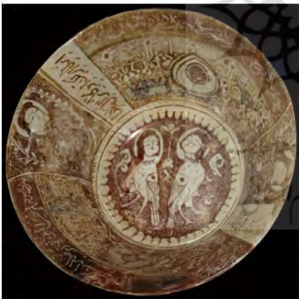
تصویر ۱۲: کاسه سفالین زرین‌فام، به شماره ثبت ۳۱۴ سین، کاشان، اوایل سده هفتم هجری قمری (موزه آگینه ۱۳۹۵)