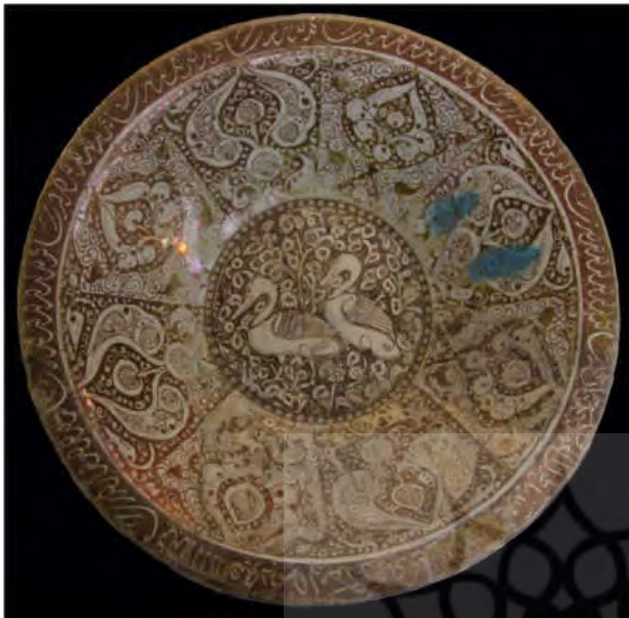
تصویر ۸: بشقاب سفالین زرین فام، به شماره ثبت ۹۴ سین، کاشان، اوایل سده هفتم هجری قمری (موزه آبگینه ۱۳۹۵)

یکی از سفال‌هایی که از این نقش برای تزئین آن استفاده شده، بشقابی است که در مرکز آن در درون قابی دایره‌وار، لابه‌لای نقوش اسلیمی و تزیینات گیاهی نقش این پرنده به صورت قرینه و نیم‌رخ، در میان علفزار تکرار شده است (تصویر ۸). لک لک عموماً مرغی خوش‌یمن و نماد مهر و مودت پدرفرزندی به شمار می‌رود. این پرنده مظهر عقل و خرد، زندگی‌های متوالی و رایج‌ترین نماد طول عمر طولانی و نماد جاودانی به حساب می‌آید. به‌علاوه این پرنده مبشر بهار و نشانه ازدواج و تولد است. فراتر از این، لک لک در فرهنگ عامیانه اقوام غربی و شرقی نماد پرهیزگاری به شمار می‌رفت، زیرا این‌گونه از پرندگان که بی‌حرکت و تنها روی یک پا می‌نشینند، یادآور مراقبه و کشف و شهود هستند (شوالیه و گریبان ۱۳۸۷، ج. ۵: ۱۵-۱۶؛ هال ۱۳۸۰، ۹۲).