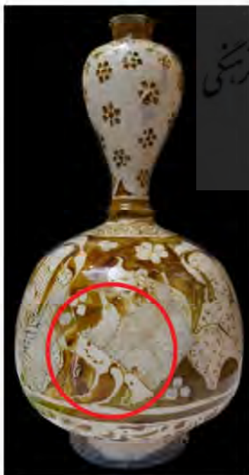
تصویر ۷: تنگ سفالین زرین فام، به شماره ثبت ۱۴۰، کاشان، اوایل سده هفتم هجری قمری (موزه آگینه ۱۳۹۵)

طاووس سمبل خورشید است و معانی سمبلیک از پادشاهی، تجمل، تکبر، جلال و شکوه، رستاخیر، فناپذیری، زندگی توأم با عشق در خود دارد (شیخی نارانی ۱۳۸۹، ۲۸). پیشینیان طاووس را نابودکننده مار و عامل حاصلخیزی زمین دانسته‌اند؛ به همین دلیل است نقش این پرنده در دو طرف درخت زندگی به‌نشانه برکت و باروری در مقابل مقابل قحطی و خشکی نشان داده شده است (صادقی‌نیا و پوزش ۱۳۹۵، ۵۶). در دوران باستان در آیین زرتشت به‌عنوان مرغی مقدس مورد