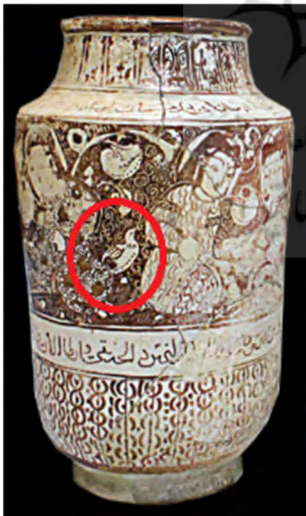
تصویر ۹: تنگ سفالین زرین فام، به شماره ثبت ۱۴۷ سین، کاشان، اواخر سده ششم هجری قمری (موزه آبگینه ۱۳۹۵)

در بررسی سفال‌های زرین فام کاشان و در گروه آبزیان، تنها موجوی که تصویرنگاری شده، ماهی است. نوع و شیوه طراحی اندام ماهی تداعی‌کننده حرکت موجود در آب است که به صورت چند ماهی درون قاب یا حوضی ترسیم شده‌اند (تصاویر ۱۰ و ۱۱). ماهی چون به آب زنده است، از آن به‌عنوان نمودی برای آب، باران، تازگی و طراوات استفاده می‌شده است. ماهی را برای تجسم دریا و آب که منشأ باروری شناخته می‌شد به کار می‌بردند (حاتم ۱۳۷۴، ۳۶۷-۳۶۸). از سوی دیگر نقش ماهی، بیش از همه در