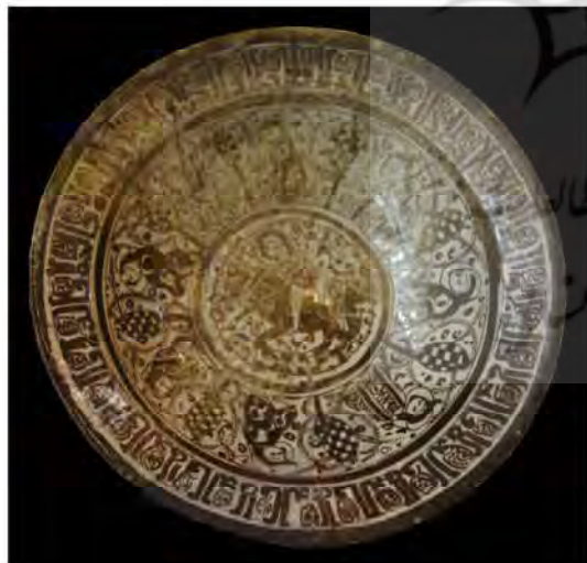
تصویر ۳: بشقاب سفالین زرین فام، به شماره ثبت ۳۲۰ سین، کاشان، اواخر سده ششم هجری قمری (موزه آبگینه ۱۳۹۵)