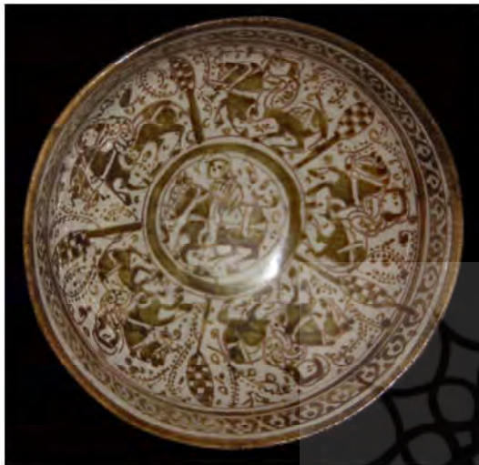
تصویر ۲: کاسه سفالین زرین فام، به شماره ثبت ۱۰۳ سین، کاشان، اواخر سده ششم هجری قمری (موزه آبگینه ۱۳۹۵)

در ظروف زرین فام دوران میانه کاشان، اسب اغلب به عنوان مرکب سوارکاران ترسیم شده است. علت این امر را می توان به جنبه مادی و معنوی اسب در زندگی، معیشت، نیروی نظامی همچنین در مراسم سوگند و تدفین و تقدس بودن آن برشمرد (سروری ۱۳۸۹، ۲۵۳-۲۶۸). استفاده از این نقش مایه، همراه با سوارکار در حال حرکت دیده می شود. سوارکاران و اسبان آن ها با تزئینات مشابه تصویر شده اند. اسبان ترسیم شده با جثه ای کوچک، گردن و ساق هایی درشت دیده می شوند (تصویر ۱-۳).