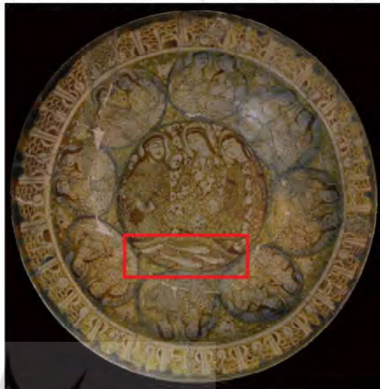
تصویر ۱۰: بشقاب سفالین زرین‌فام، به شماره ثبت ۹۵ سین، کاشان، اواخر سده ششم هجری قمری (موزه آگینه ۱۳۹۵)