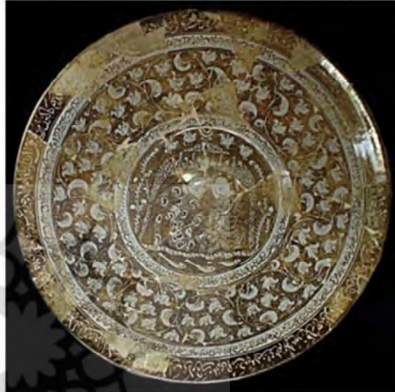
تصویر ۵: بشقاب سفالین زرین فام، به شماره ثبت ۲۸۴، کاشان، اوایل سده هفتم هجری قمری (موزه آگینه، ۱۳۹۵)