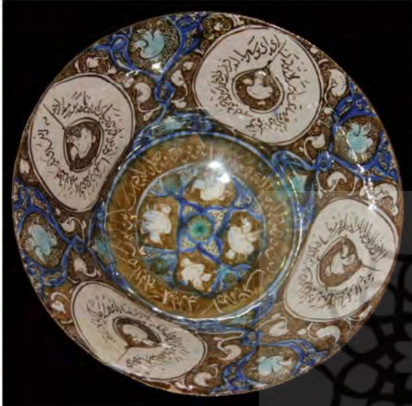
تصویر ۶: کاسه سفالین زرین فام، به شماره ثبت ۱۲۳، کاشان، اوایل سده هفتم هجری قمری (موزه آگینه ۱۳۹۵)

موضوع بخشی اعظمی از نقوش حیوانی ظروف زرین فام دوره میانه را اردک‌های در حال پرواز نشان می‌دهد که در ترکیب‌بندی با متن زمینه اصلی به کار رفته‌اند (پوپ ۱۳۸۷، ج. ۴: ۱۸۷۰). اردک از پرندگانی است که در سفال‌های زرین فام مورد مطالعه بسیار نقش شده است. این نقش مایه را به صورت دسته‌ای از اردک‌های چاق در حال پرواز در لابه‌لای نقوش هندسی و گیاهی می‌توان مشاهده کرد (تصاویر ۵-۶). اردک سمبل وصلت و نیکبختی و نماد پیوند زناشویی است که گاهی به آن مفهوم قدرت حیاتی نیز افزوده می‌شود. علت این امر آن است که اردک نر و ماده همیشه با هم شنا می‌کنند. این نماد اغلب در شمایل‌نگاری به‌منظور نشان دادن امیدها و آرزوها به کار می‌رود (شوالیه و گربران ۱۳۷۹، ج. ۱: ۱۱۲-۱۱۳).