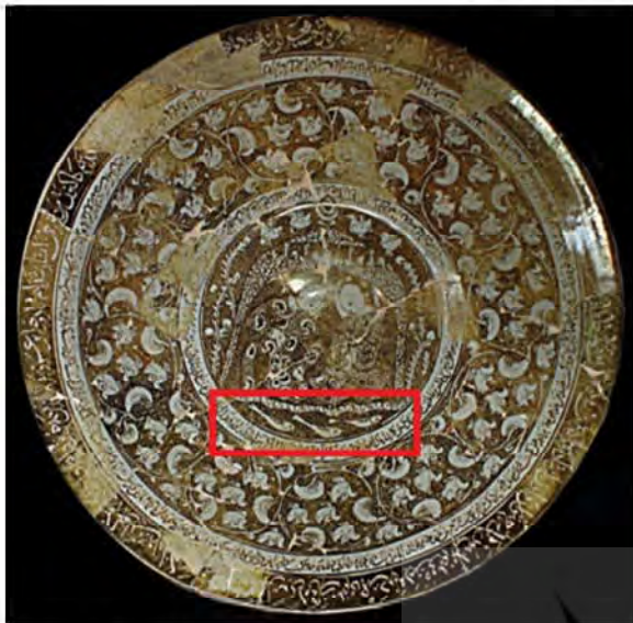
تصویر ۱۱: بشقاب سفالین زرین‌فام، به شماره ثبت ۲۸۴ سین، کاشان، اوایل سده هفتم هجری قمری (موزه آگینه ۱۳۹۵)

شکل نمادین در معرفی ایزدان و توانایی‌هایشان دیده می‌شود و از آن به‌عنوان نمادی در برابر نیروهای اهریمنی و طلسم محافظتی، همین‌طور خوشبختی، مقاومت و ایستادگی یاد می‌شود (افضل طوسی ۱۳۹۲، ۱۰۸-۱۱۰).