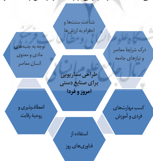
نمودار ۳: عوامل مورد نظر در طراحی سناریو برای صنایع دستی معاصر ایران