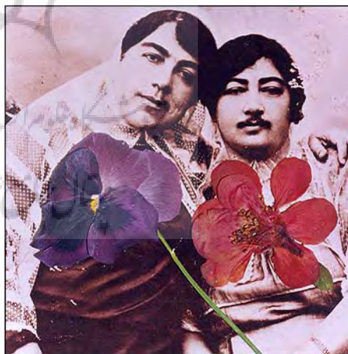
تصویر ۹، بهمن جلالی، زنان قاجاری و گل‌ها، ۱۳۷۸. Figure9, Bahman Jalali, Qajar women & flowers http://www.silkroadartgallery.com/bahman-jalali

گلبرگ‌ها شده است، طوری که مقداری از محتوای عکس از زیر گلبرگ‌ها دیده می‌شود (تصاویر ۶، ۷ و ۸). گل‌ها و