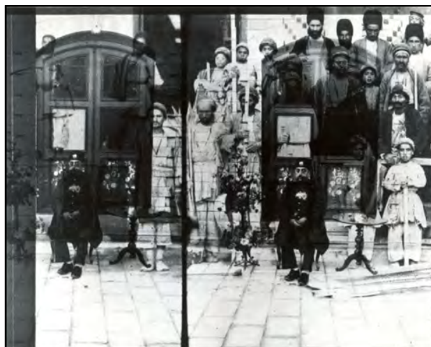
تصویر ۱، بهمن جلالی، سیاه و سفید، ۱۳۷۸. Figure1, Bahman Jalali, black & White, 2000 http://www.silkroadartgallery.com/bahman-jalali

http://www.silkroadartgallery.com/bahman-jalali