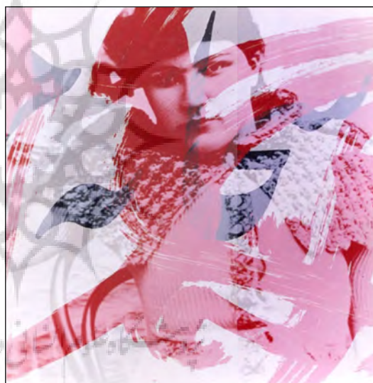
تصویر ۳، بهمن جلالی، قرمز، ۱۳۷۸. Figure3, Bahman Jalali, Red, 2000 http://www.silkroadartgallery.com/bahman-jalali