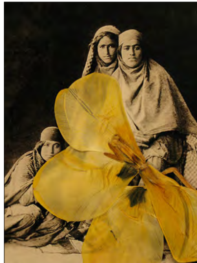
تصویر ۷، بهمن جلالی، زنان قاجاری و گل‌ها، ۱۳۷۸. Figure7, Bahman Jalali, Qajar women & flowers http://www.silkroadartgallery.com/bahman-jalali

بهمن جلالی برای ایجاد این تصاویر گلبرگ‌ها را بین یک شیشه و عکس قرار می‌داد تا گل یا گلبرگ‌ها به عکس بچسبند (تصاویر ۹ و ۱۰). در بعضی از این تصاویر گلبرگ‌ها را روی شیشه قرار می‌داد و بین شیشه و عکس فاصله ایجاد می‌کرد تا از بین این فاصله نور عبور کند. ۳۶ عبور نور از بین شیشه و عکس باعث ایجاد حالتی پشت‌نما ۳۷ و شفاف در