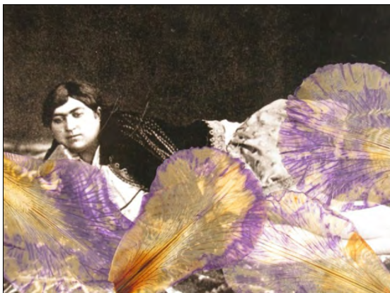
تصویر ۶، بهمن جلالی، زنان قاجاری و گل‌ها، ۱۳۷۸. Figure 6, Bahman Jalali, Qajar women & flowers http://www.silkroadartgallery.com/bahman-jalali