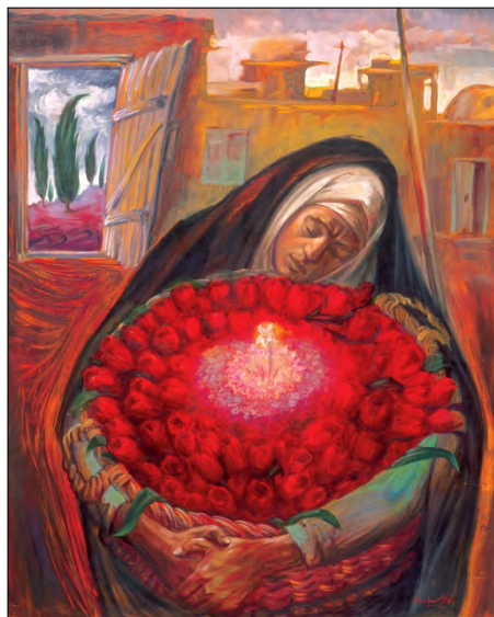
تصویر ۱۵، چشم نرگس به شقایق نگران خواهد شد، کاظم چلیپا، ۱۳۶۳، ۱۳۰×۱۶۰ س.م، کتاب نقاشی انقلاب، مرتضی‌گودرزی (دبیاج)، ۱۳۹۰، ۲۴۶ Figure 15, Kazem Chalipa, 1985, 130×160cm, Revolution's painting book, Morteza Godarzi, 2012, 246

بهمن جلالی از شروع عکاسی تا پایان عمر به دنبال موضوع‌هایی بود تا بتواند تغییری مثبت در سیاست‌های اجتماعی دوران خود ایجاد کند، دغدغه‌ای که غالب هنرمندان بخصوص فتوژنالیست‌ها از ثبت واقعیت دارند. آنچه در برخورد اول از انتخاب بهمن جلالی از تصویر زنان قاجاری و مرثیه‌خوانی برای این افراد به نظر می‌رسد، توجه به زنانی است که هم در دوران پس از انقلاب و همچنین در دوران قاجار به دلیل تعصب‌های مذهبی و جامعه‌ای مردسالار مورد بی‌توجهی قرار گرفته‌اند. بهمن جلالی با مجموعه‌ی «تصویر خیال» ذهن مخاطب را، از زمان حال به دوران قاجار متصل می‌کند اما برای درک این اتصال و چرایی آن و درک مفهوم این تصاویر، نیازمند به تجزیه و تحلیل و انطباق این تصاویر با متون تصویری و ادبی، فرهنگ و باورهای جامعه‌ای هستیم که اثر در آن خلق شده است، باورهایی که قدمتی هزاران ساله دارند و از دوران باستان تا به امروز در فرهنگ و هنر مردم ایران تکرار شده‌اند. همچنین با بررسی آیکون گل در بسیاری از آثار ادبی و هنری ایران در طول تاریخ، به مفهومی مشابه از گل مواجه می‌شویم که همه ریشه در فرهنگ و تمدن مردم ایران دارند.