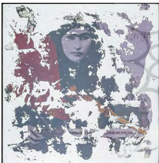
تصویر ۴، بهمن جلالی، آینه، ۱۳۷۸. Figure4, Bahman Jalali, Mirror, 2000 http://www.silkroadartgallery.com/bahman-jalali