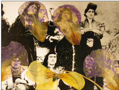
تصویر ۸، بهمن جلالی، زنان قاجاری و گل‌ها، ۱۳۷۸. Figure8, Bahman Jalali, Qajar women & flowers http://www.silkroadartgallery.com/bahman-jalali

تعدادی از این عکس‌ها نیز زنان وابسته به طبقه عوام به نظر می‌آیند. در این تصاویر زنان و یا بخشی از تصویر آنان با گل‌های بنفشه و شقایق به صورت کامل یا گلبرگ‌های پرپر شده پوشانده شده‌اند.