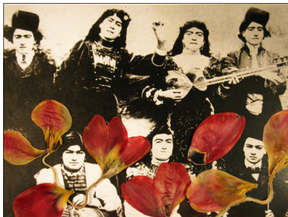
تصویر ۵، بهمن جلالی، زنان قاجاری و گل‌ها، ۱۳۷۸. Figure 5, Bahman Jalali, Qajar women & flowers http://www.silkroadartgallery.com/bahman-jalali

تشخیص ۲۴ یا چپستی آیکون مورد بررسی قرار می‌گیرد و مرحله‌ی سوم آیکونولوژی است که در این مرحله به تفسیر و چرایی آنچه در مراحل قبل مشخص شده پرداخته می‌شود. لازم به ذکر است چنانچه پانوفسکی خود نیز بیان می‌کند دو مرحله آیکونوگرافی و آیکونولوژی در مواردی به طور دقیق و مجزا قابل شناسایی و تفکیک نمی‌باشند (Panofsky, 1955, 39)، از این رو با وجود توضیحات مبنی بر تفکیک مراحل سه‌گانه پانوفسکی، برای جلوگیری از هرگونه ابهامی در این پژوهش به مرز بندی دقیق و مشخص مراحل پرداخته نخواهد شد. ۲۵