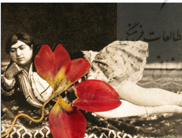
تصویر ۱۰، بهمن جلالی، زنان قاجاری و گل‌ها، ۱۳۷۸. Figure10, Bahman Jalali, Qajar women & flowers http://www.silkroadartgallery.com/bahman-jalali

(۹) آغاز می‌شود. این مجموعه کلاژی از تصاویر سیاه و سفیدی از پرتره‌های زنان قاجاری است، که بهمن جلالی با عکاسی مجدد از ترکیب عکس‌های دوره قاجار، یعنی نگاتیوهای یافته شده از کاخ گلستان، با گلبرگ‌هایی که روی شیشه قرار داده، بدست آورده است. با تکیه بر نوع