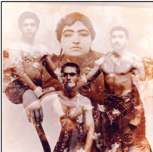
تصویر ۲، بهمن جلالی، قهوه‌ای، ۱۳۷۸. Figure2, Bahman Jalali, Brown, 2000

http://www.silkroadartgallery.com/bahman-jalali