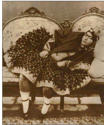
تصویر ۱۲، ناصرالدین شاه، انیس الدوله، ۱۲۵۰، کتاب تاریخ عکاسی و عکاسان پیشگام ایران، ۳۲. Figure12, Naser al-Din Shah Qajar, Anisodole, 1871, History of photography & pioneer photographers of Iran book, 32