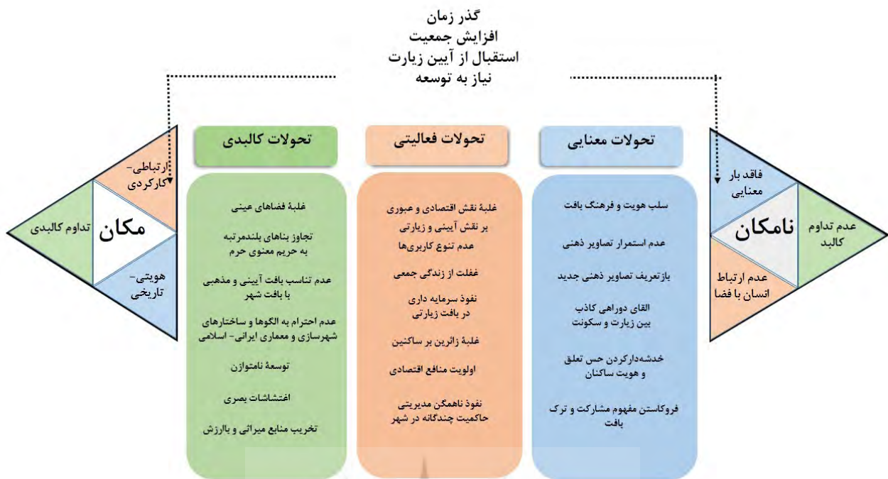
تصویر ۶. ارزیابی عوامل تأثیرگذار کالبدی، فعالیتی و معنایی بر سیر تبدیل مکان به نامکان در محور امام رضا (ع).