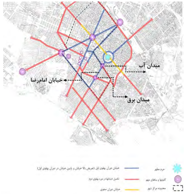
تصویر ۳. تحولات کالبدی از دوره صفوی تا پهلوی.

در راستای تحلیل محور، عدم توجه به معنا از مهم‌ترین دلایل عدم موفقیت طرح موجود است. بدین سبب با تمرکز بیشتر بر بعد معنایی مکان، در گام سوم با استفاده از رویکرد کیفی اقدام به کشف معنای خیابان امام رضا (ع) شد، تا بتوان به نقش محور در شهر و معنای آن در ذهن مخاطبان فضا پی برد. در