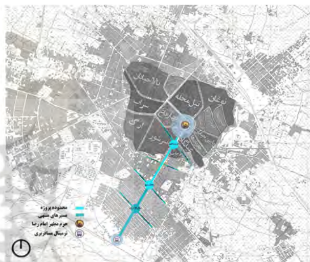
تصویر ۲. موقعیت خیابان امام رضا (ع) در شهر مشهد.

پس از انقلاب اسلامی کانون توجه و توسعه بار دیگر به جهت