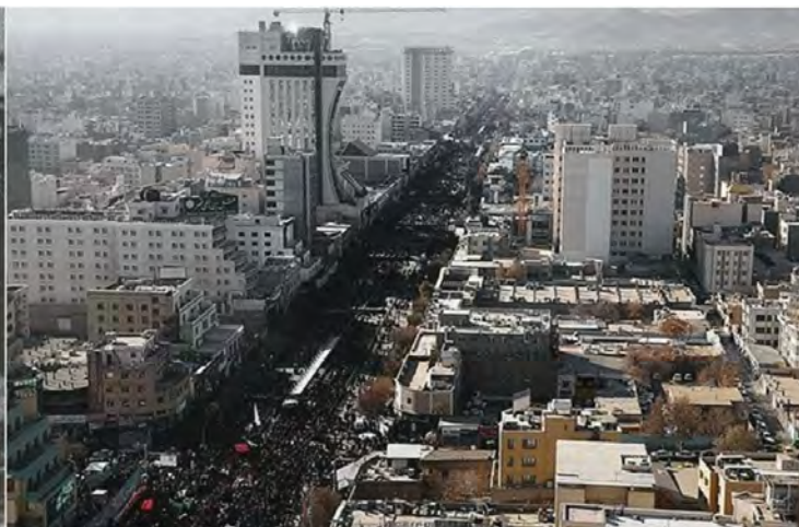
تصویر ۴. خیابان تهران در گذر زمان.

جدول ۲. بررسی اقدامات کالبدی و آثار و نتایج آن بر بافت پیرامونی مکان مقدس.