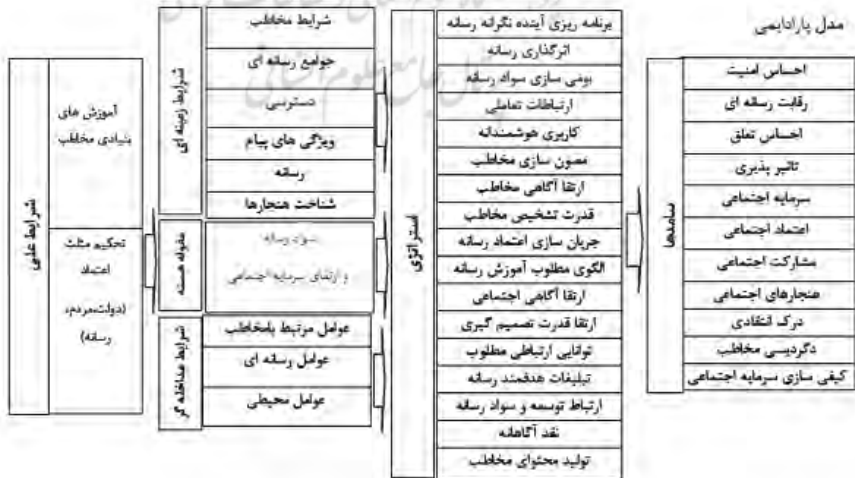
نمودار ۳. مدل پارادایمی

خاستگاه فناوری و رسانه: این مفهوم در دسته «شرایط زمینه‌ای» قرار داده شده است. بدیهی است که ابزار و وسایل برای پاسخ‌گویی به نیازهای انسان تولید می‌شوند؛ هر فناوری در واقع خاستگاهی دارد و اگر فناوری بدون احساس نیاز اولیه و بدون ایجاد تشنگی در مخاطبان به جامعه‌ای عرضه شود، قطعاً کارکردهای مناسبی ندارد یا کمتر دارد. رسانه به‌عنوان یک فناوری از این قاعده مستثنا نیست و خاستگاه رسانه یا شرایط زمینه‌ای جامعه‌ای که در آن رسانه ورود می‌کند رابطه مستقیمی با کارکردهای آن رسانه دارد. به عبارتی، اگر فناوری بدون احساس نیاز اولیه وارد جامعه شود، در خوش‌بینانه‌ترین حالت، به آن فناوری به‌عنوان کالای لوکس یا سرگرم‌کننده نگاه می‌شود و کارکرد اصلی خود را بروز نمی‌دهد. بنابراین، شرایط زمینه‌ای خاستگاه فناوری و رسانه از جهت کارایی بیشتر و مفیدتر حائز اهمیت است.