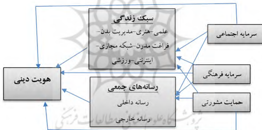
شکل ۱- مدل تجربی تحقیق