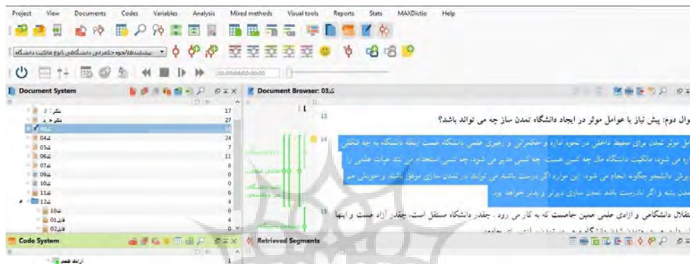
شکل 1: نمایی از کدگذاری داده‌ها در نرم‌افزار مکس.کیو.دی.ای

تفسیرها را تأیید کردند. برای ارزیابی تعمیم‌پذیری، پژوهشگران به شرح فرایند پژوهش از نمونه‌گیری تا تفسیر یافته‌ها پرداختند و نمونه‌ای از متن مصاحبه‌ها را به عنوان مصادیق ارائه کردند؛ به نحوی که خواننده بتواند انتقال‌پذیری آن را ارزیابی کند. همچنین برای بررسی اطمینان‌پذیری از نتایج، جمع‌آوری و تحلیل داده‌ها تحت نظارت چند تن از اساتید انجام گرفت و در نهایت، برای ارزیابی تأیید‌پذیری نتایج، یافته‌های پژوهش در اختیار اساتید مذکور قرار گرفت و به تأیید رسید. نمایی از کدگذاری داده‌ها در نرم‌افزار مکس.کیو.دی.ای 1 در شکل 1 ارائه شده است.