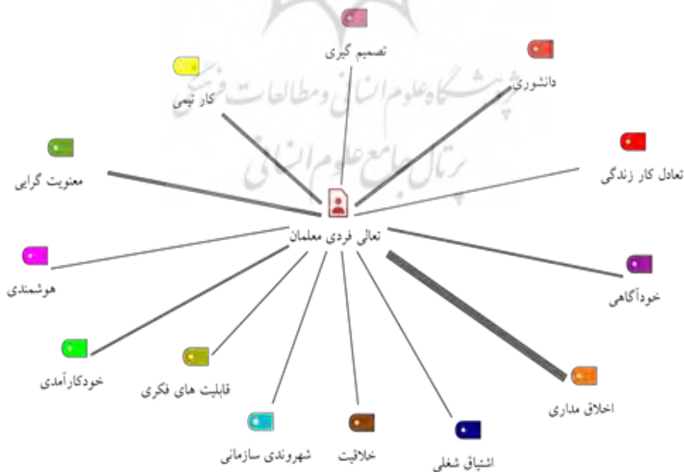
شکل ۱. مدل اکتشافی کیفی ارزیابی تعالی فردی معلمان

به‌منظور پاسخگویی به این سؤال، بر اساس کدگذاری انتخابی، مفهوم تعالی فردی شامل ۱۳۴ کد باز و ۱۳ مؤلفه (قابلیت‌های فکری، هوشمندی، دانشوری، خودآگاهی، خودکارآمدی، کار تیمی، معنویت‌گرایی، تصمیم‌گیری، شهروندی سازمانی، اخلاق‌مداری، خلاقیت و ابتکار، اشتیاق شغلی و تعادل کار و زندگی) می‌باشد که با نرم‌افزار مکس کیودا در یک شمای کلی به‌صورت شکل (۱) نشان داده شده است.