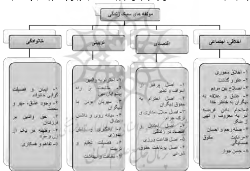
شکل ۲. مدل مفهومی پژوهش

۶- راهبردها: اتخاذ سیاست های انجمن اولیا و مربیان و استقرار نظام توانمندسازی؛ راهبردها و تعاملات بیانگر رفتارها، فعالیتها و تعاملات هدف داری هستند که در پاسخ به مقوله محوری و تحت تاثیر شرایط مداخله‌گر، اتخاذ می‌شوند. به این مقوله‌ها راهبرد نیز گفته می‌شود. که در تحقیق حاضر عبارتند از: اتخاذ سیاست های انجمن اولیا و مربیان، برقراری عدالت در آموزش و استقرار نظام توانمندسازی.