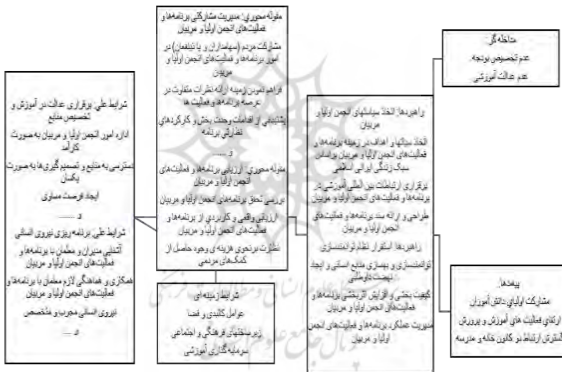
شکل ۱. کدگذاری محوری بر اساس الگوی پارادایم

در این تحقیق کدگذاری محوری بر اساس استفاده از الگوی پارادایم صورت گرفته است. بنابراین دسته‌بندی‌های فرعی با دسته‌بندی اصلی مطابق با الگوی پارادایم مرتبط می‌شوند و هدف اصلی این است که محقق را قادر سازد تا به صورت نظام مند در مورد داده‌ها و مرتبط کردن آنها تفکر کند. شکل ۲، ایجاد ارتباط بین مقوله‌های مختلف شناسایی شده را در قالب الگوی پارادایم نمایش می‌دهد.