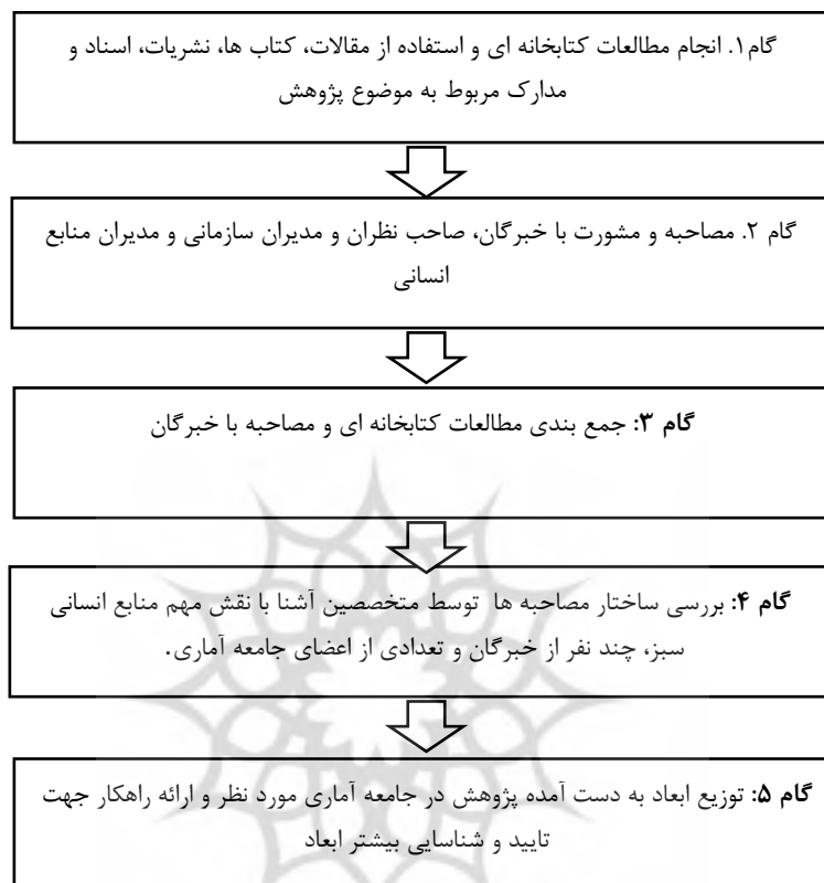
شکل ۱. روند انجام پژوهش

پژوهشگاه علوم انسانی و مطالعات فرهنگی پرتال جامع علوم انسانی