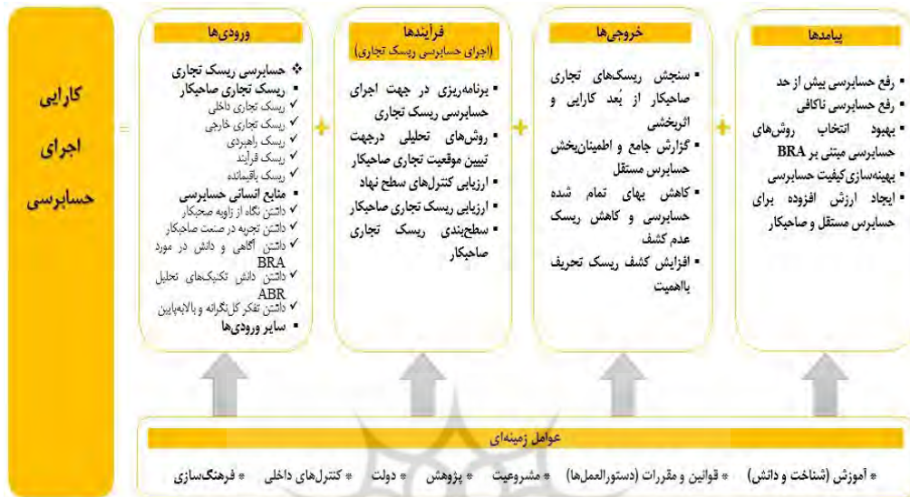
شکل ۳. مدل طراحی شده کارایی اجرای حسابرسی بر اساس رویکرد BRA